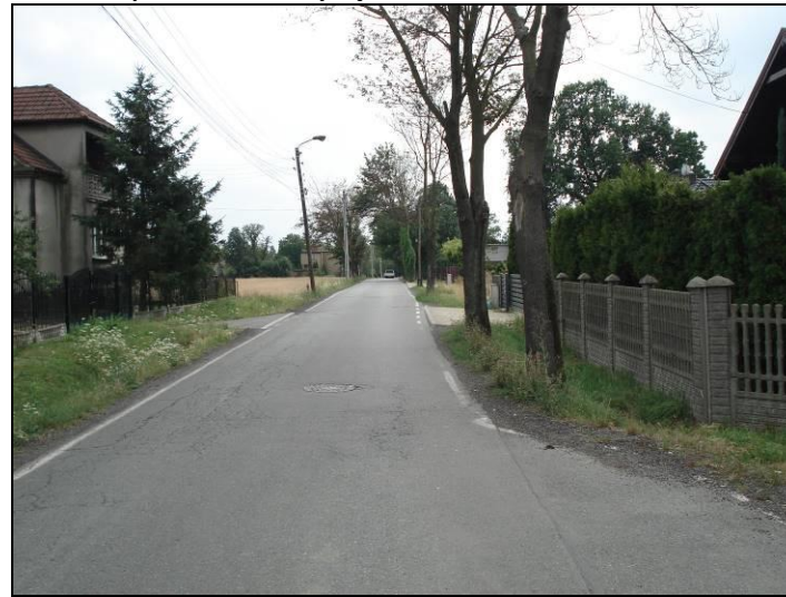
Fot. 4 Ul. Dzwonkowa, wschodnia granica obszaru