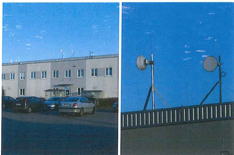
Widok obiektu wraz z zainstalowanym zespołem antenowym