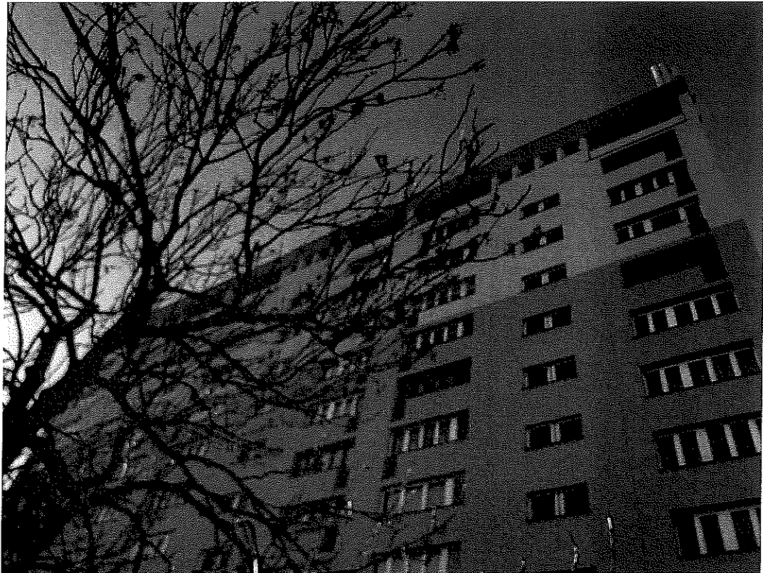
Zal. nr 1: Widok ogólny badanego obiektu.