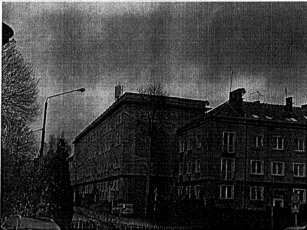
Zal. nr 1: Widok ogólny instalacji radiokomunikacyjnej.