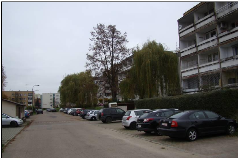
Fot. 9 Zabudowa wielorodzinna w rejonie ul. Poziomkowej