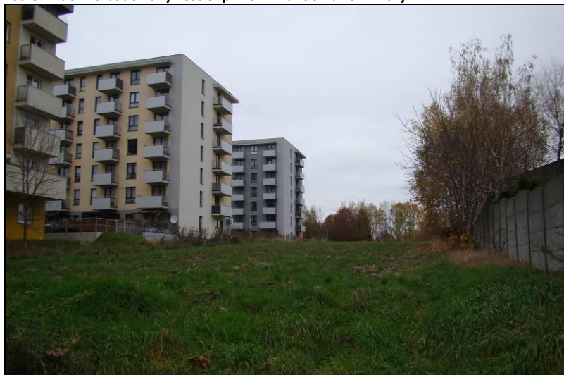
Fot. 6 Zabudowa wielorodzinna i teren rolny w części północno-wschodniej