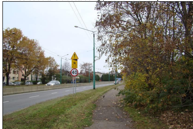
Fot. 12 Aleja Piłsudskiego, południowa granica obszaru