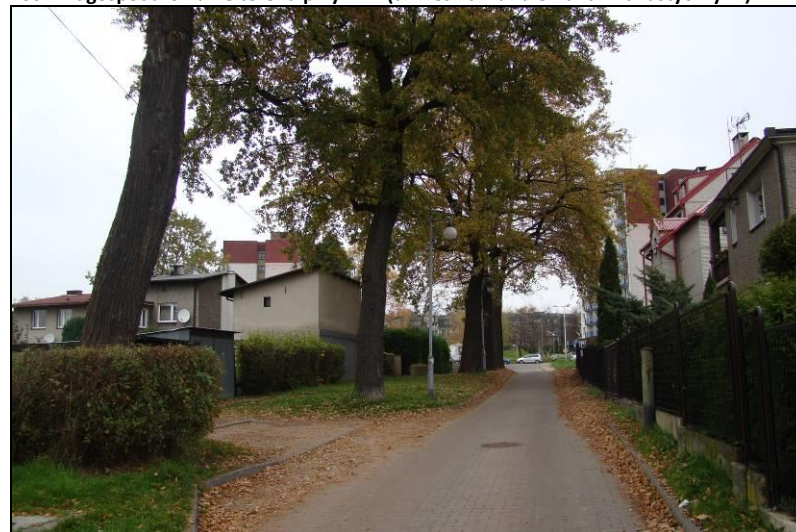
Fot. 8 Dęby na drodze łączącej ul. Przemysłową z ul. Poziomkową