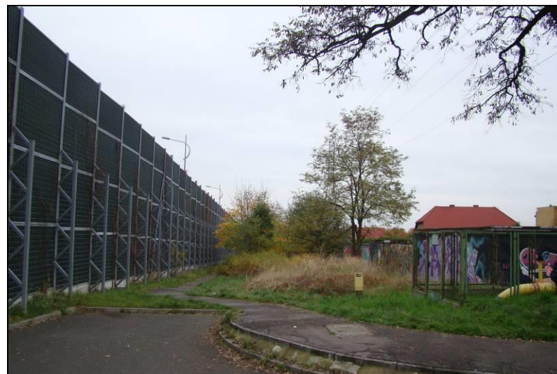
Fot. 7 Zagospodarowanie terenu przy DK1 (ul. Beskidzka za ekranami akustycznymi)