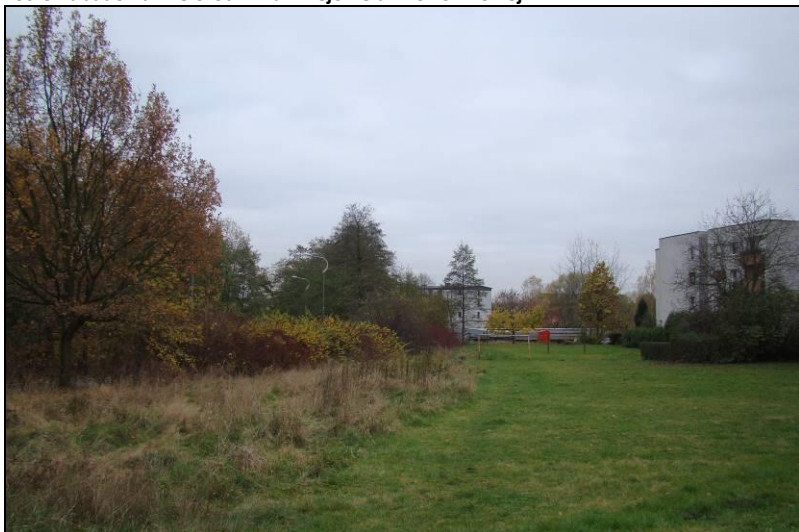
Fot. 10 Tereny zielone w rejonie ul. Poziomkowej