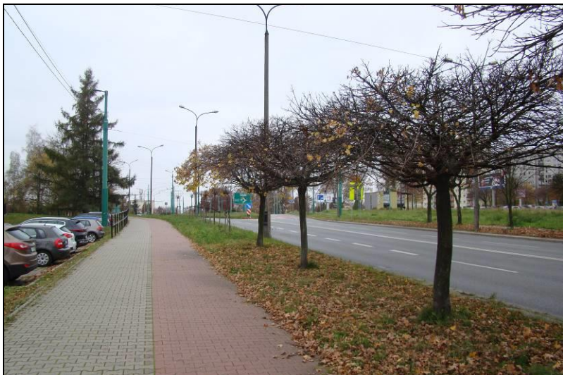
Fot. 1 Ul. Armii Krajowej, widok w kierunku południowym