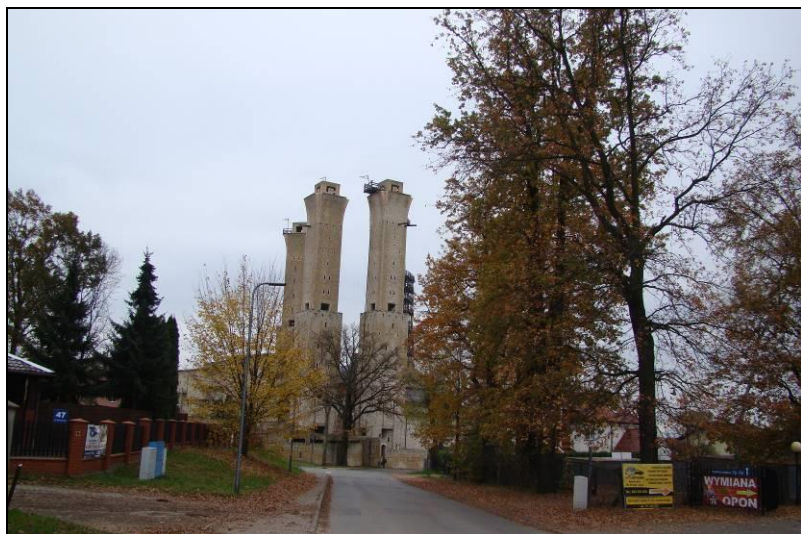
Fot. 5 Widok na budowany kościół pw. Św. Franciszka i Św. Klary