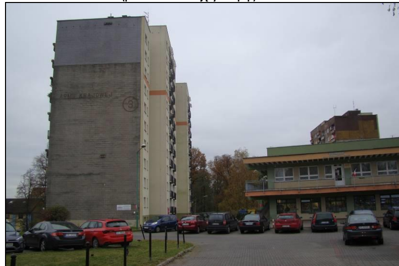
Fot. 4 Zabudowa wielorodzinnna i usługowa, północno-wschodnia część terenu