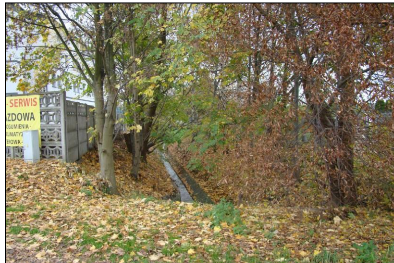
Fot. 11 Ciek o charakterze kanału deszczowego, widok z ul. Poziomkowej