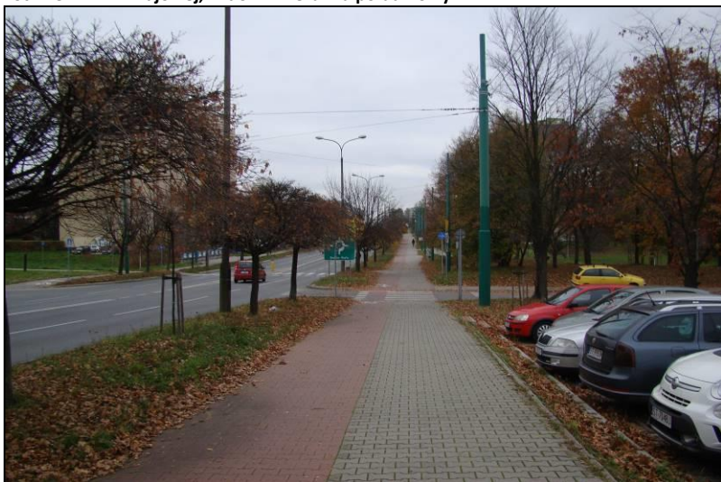
Fot. 2 Ul. Armii Krajowej, widok w kierunku północnym