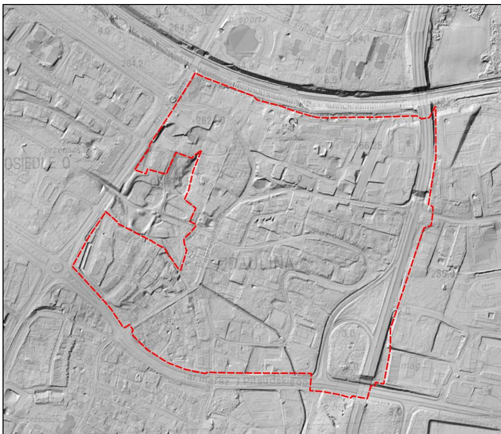
Rysunek 1 Ukształtowanie terenu na podstawie Numerycznego Modelu Terenu