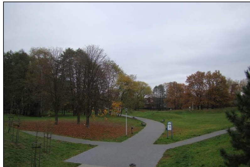
Fot. 3 Park Św. Franciszka (poza terenem objętym mpzp)