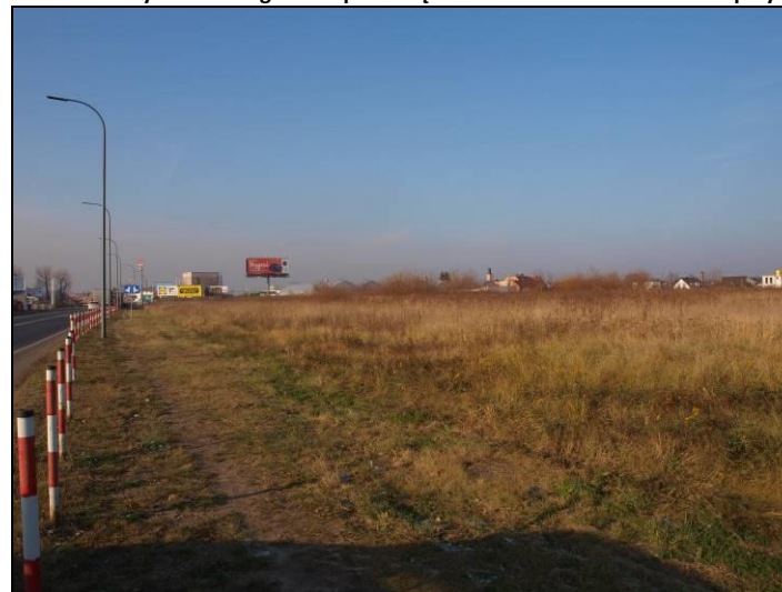
Fot. 12 Odłogowane grunty rolne na północ od ul. Katowickiej