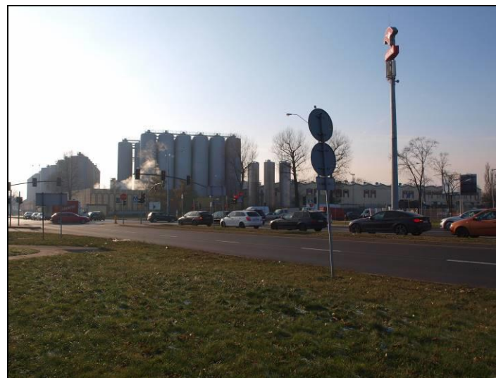
Fot. 3 Widok na Tyski Browar znajdujący się poza południową granicą opracowania