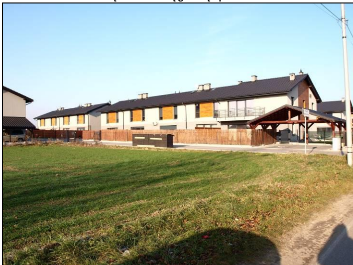
Fot. 10 Zabudowa szeregowa przy ul. Czarnej