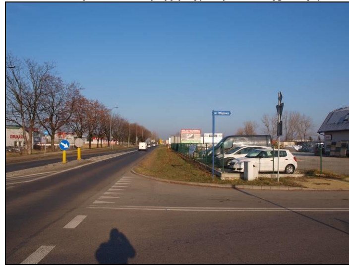
Fot. 4 Ul. Katowicka w części północno-zachodniej