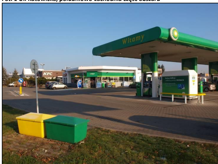
Fot. 2 Zespół usługowy w rejonie połączenia ul. Katowickiej i ul. Oświęcimskiej