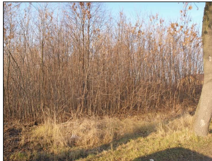
Fot. 11 Grunty rolne odłogowane porośnięte niewielkimi zadrzewieniami przy ul. Czarnej