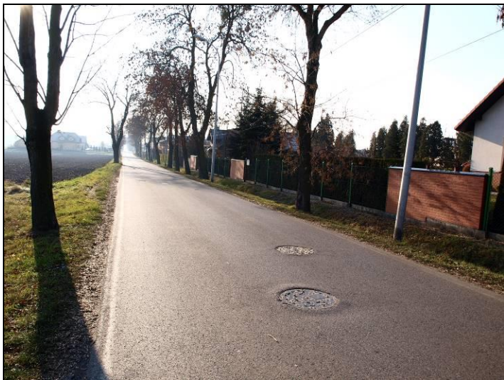
Fot. 9 Ul. Czarna stanowiąca wschodnią granicę opracowania