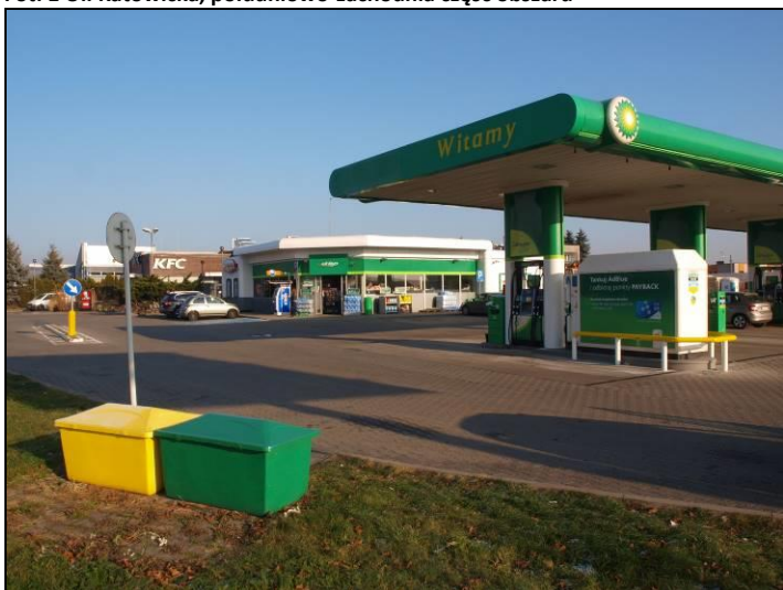
Fot. 2 Zespół usługowy w rejonie połączenia ul. Katowickiej i ul. Oświęcimskiej