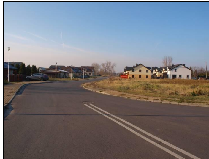
Fot. 7 Ul. Jałowcowa, północna granica opracowania