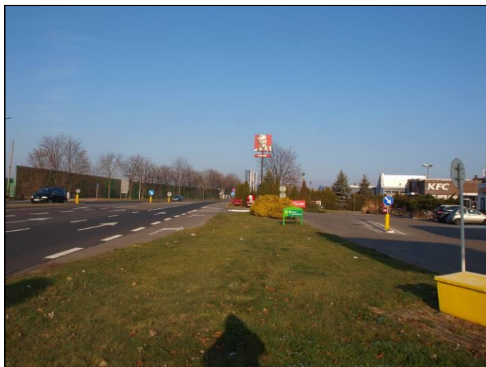
Fot. 1 Ul. Katowicka, południowo-zachodnia część obszaru