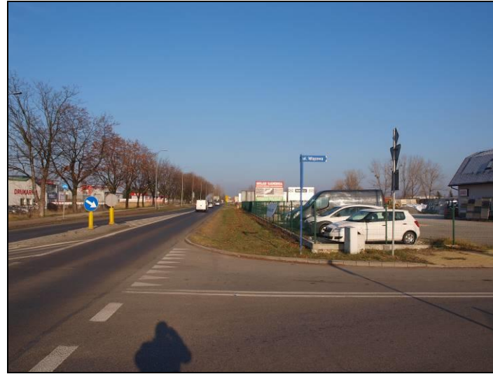
Fot. 4 Ul. Katowicka w części północno-zachodniej