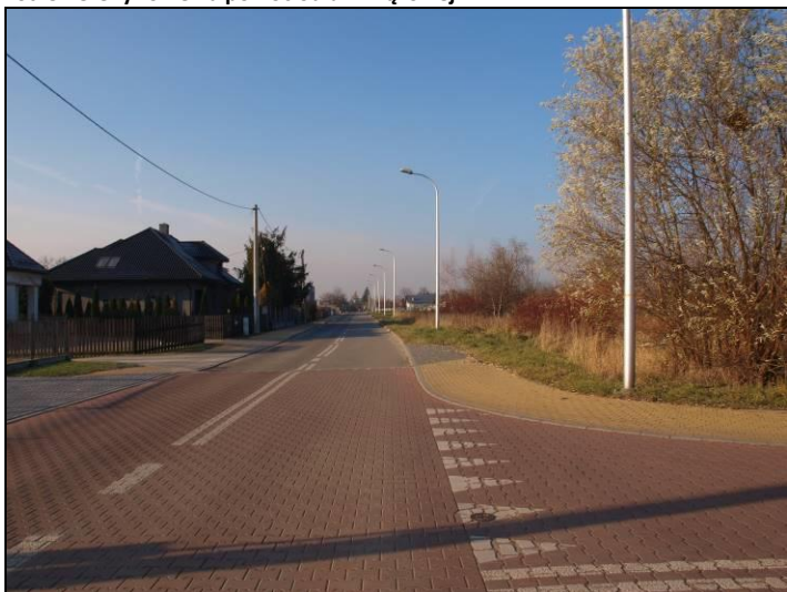
Fot. 6 Ul. Wiązowa, widok od strony wschodniej