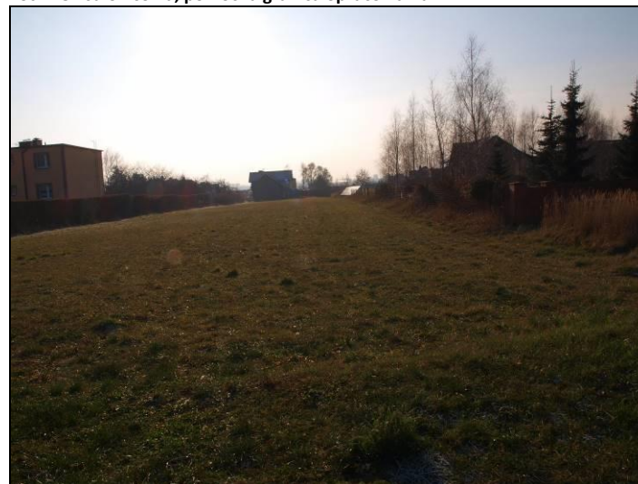
Fot. 8 Teren rolny na południe od ul. Zwierzynieckiej