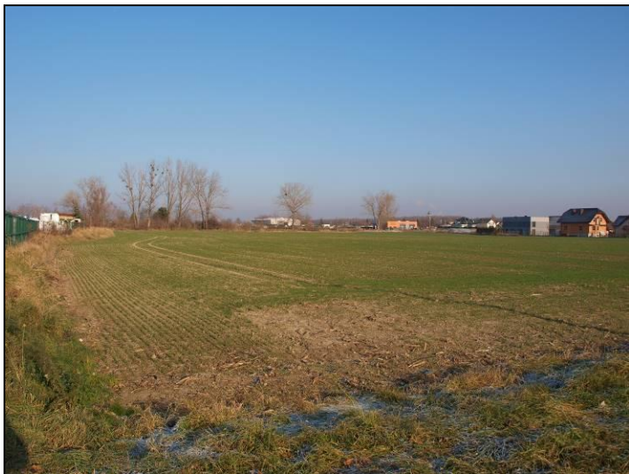
Fot. 5 Tereny rolne na północ od ul. Wiązowej