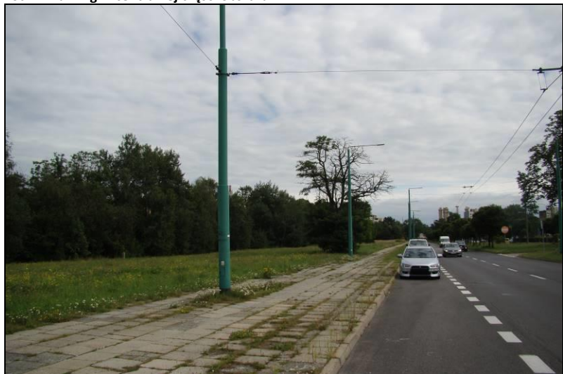
Fot. 18 Widok na południowo-wschodnią obszaru terenu nr 2 od strony ul. Jana Pawła II