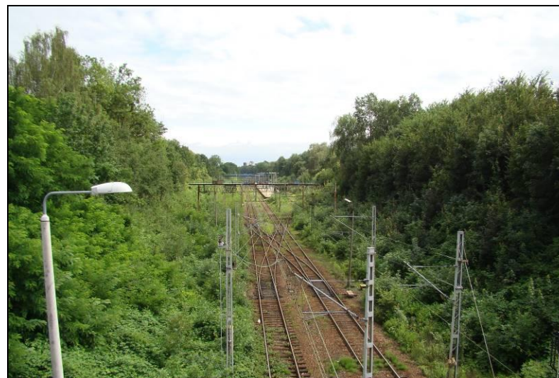
Fot. 15 Linia kolejowa przecinająca obszaru nr 2