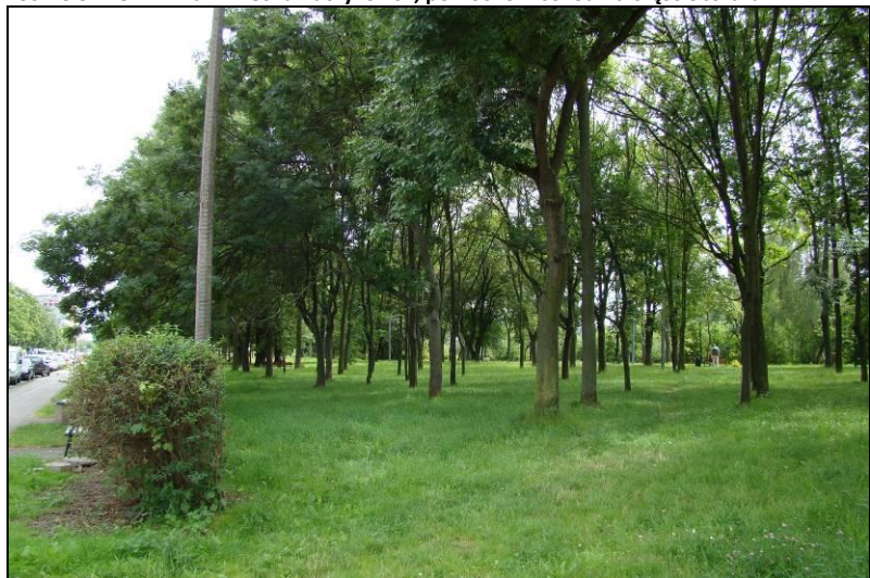
Fot. 14 Niewielki park w północno-wschodniej części obszaru nr 2