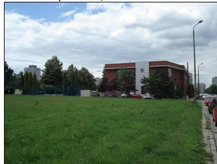
Fot. 12 Obszar nr 2, budynek poczty, widok od strony ul. Dąbrowskiego