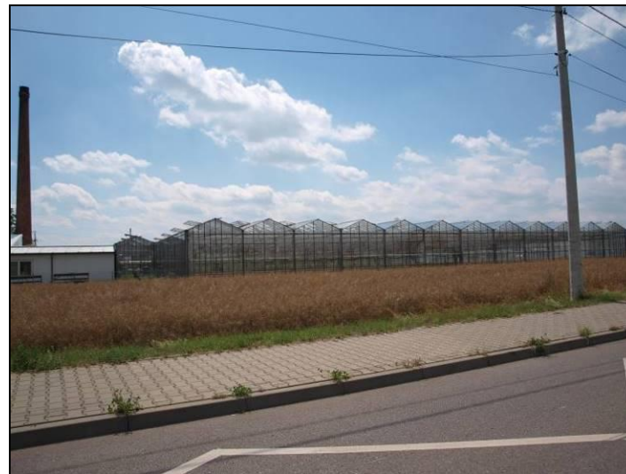
Fot. 3 Zespół szklarni w północno-zachodniej części obszaru nr 1