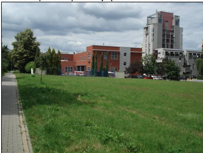
Fot. 10 Budynek poczty w części centralnej obszaru nr 2