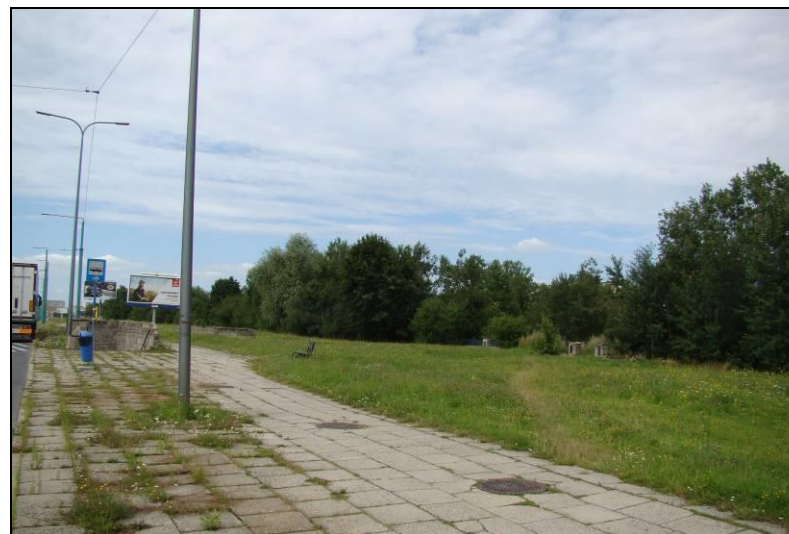
Fot. 19 Widok na południowo-zachodnią część obszaru nr 2 od strony ul. Jana Pawła II