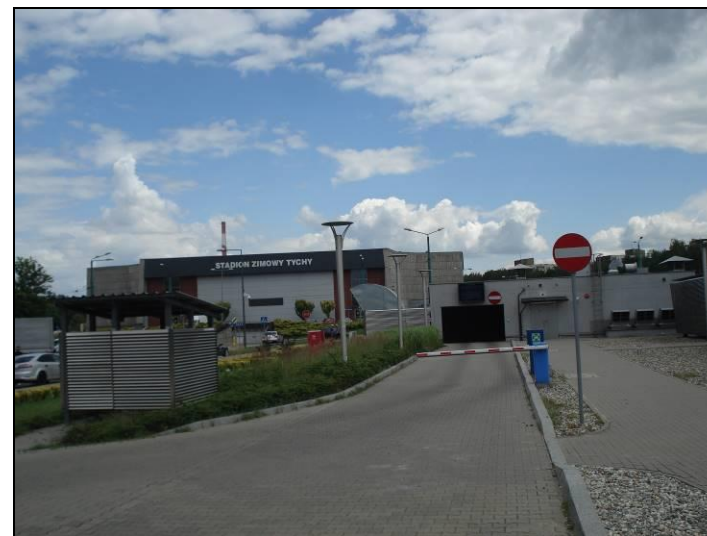
Fot. 7 Parking we wschodniej części obszaru nr 2