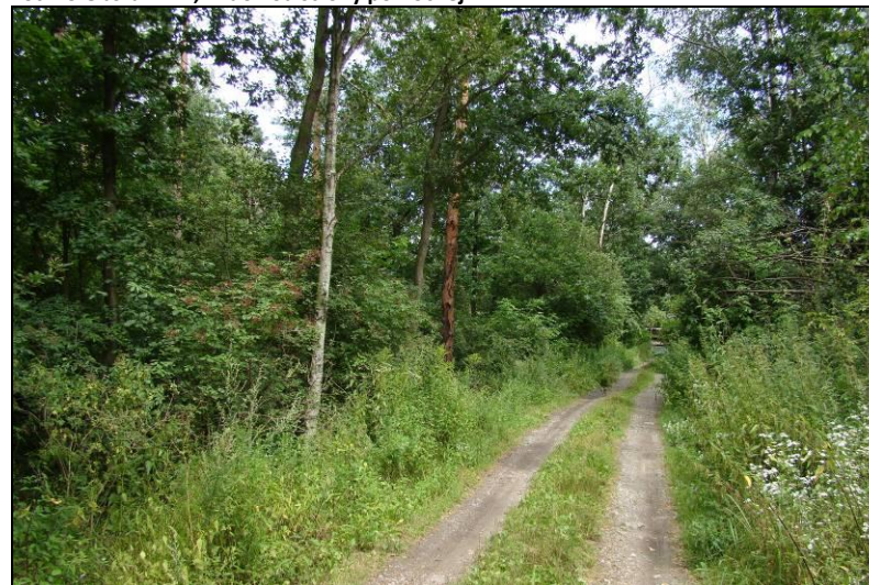
Fot. 24 Obszar nr 4, widok od strony południowej