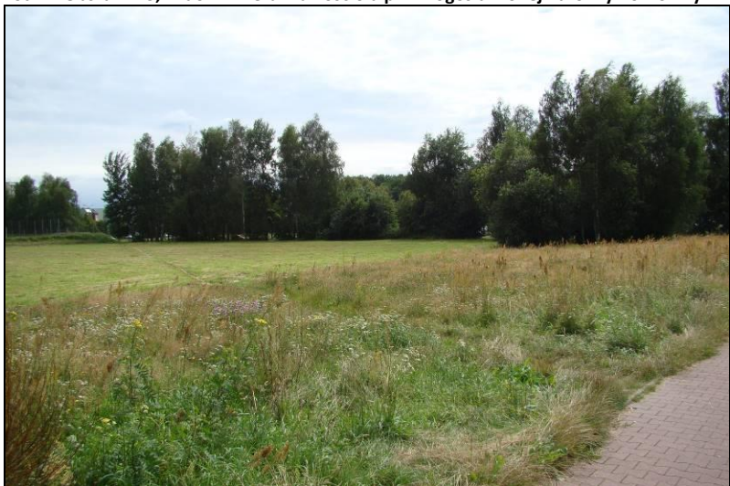
Fot. 22 Obszar nr 3, widok w kierunku południowo-wschodnim