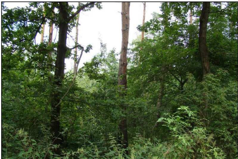
Fot. 25 Wnętrze obszaru nr 4, las o charakterze gospodarczym