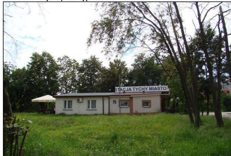
Fot. 16 Stacja kolejowa Tychy Miasto w centralnej części obszaru nr 2