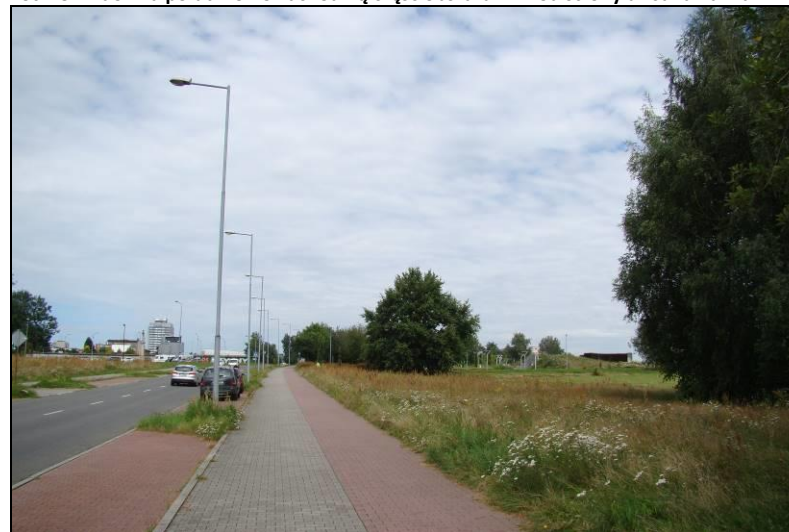
Fot. 20 Obszar nr 3, widok w kierunku północnym od strony ul. Uczniowskiej