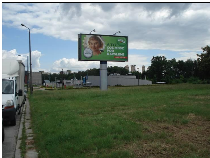
Fot. 6 Obszar nr 2, widok w kierunku wschodnim na parking