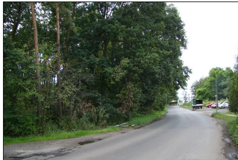
Fot. 23 Obszar nr 4, widok od strony północnej