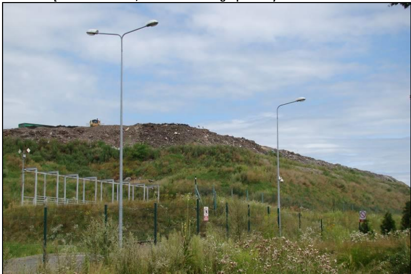
Fot. 26 Składowisko odpadów na północny wschód od obszaru nr 4