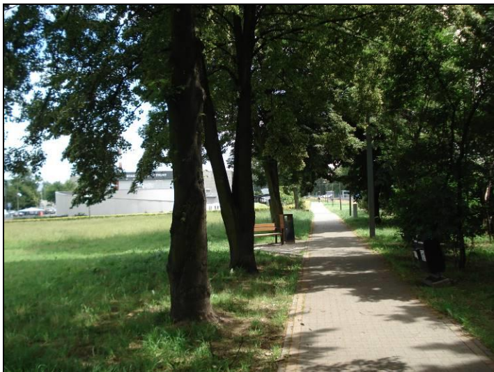
Fot. 9 Ścieżka spacerowa w południowej części obszaru nr 2