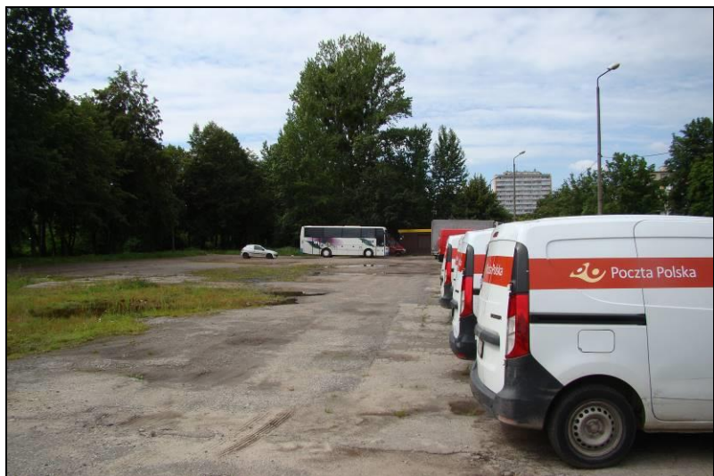
Fot. 17 Parking w centralnej części obszaru nr 2