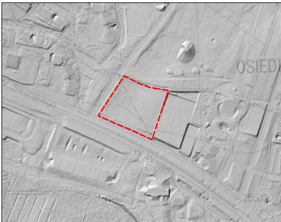
Rysunek 3 Ukształtowanie obszaru nr 3 na podstawie Numerycznego Modelu Terenu