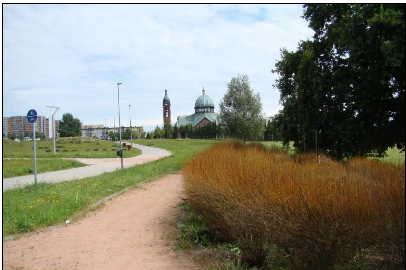
Fot. 21 Obszar nr 3, widok w kierunku kościoła pw. Błogosławionej Karoliny Kózkówny