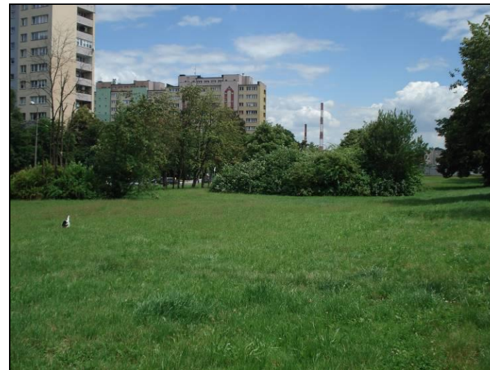
Fot. 11 Centralna część obszaru nr 2, widok w kierunku wschodnim