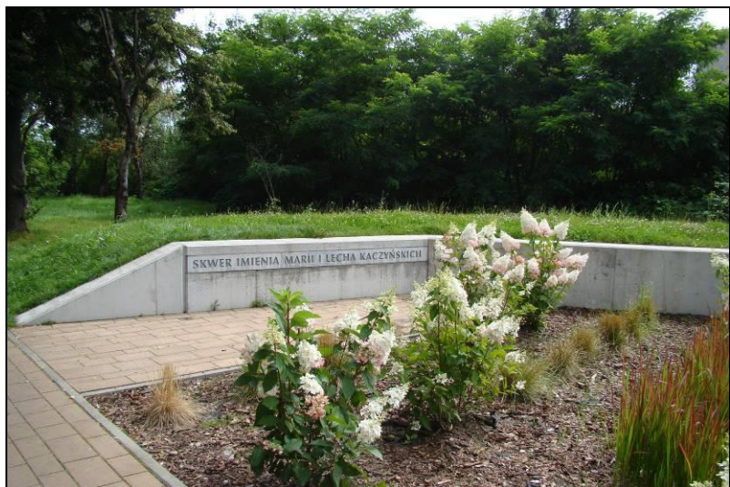
Fot. 13 Skwer im Marii i Lecha Kaczyńskich, północno-wschodnia część obszaru nr 2