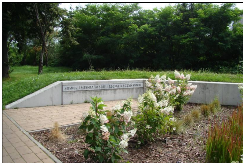
Fot. 13 Skwer im Marii i Lecha Kaczyńskich, północno-wschodnia część obszaru nr 2