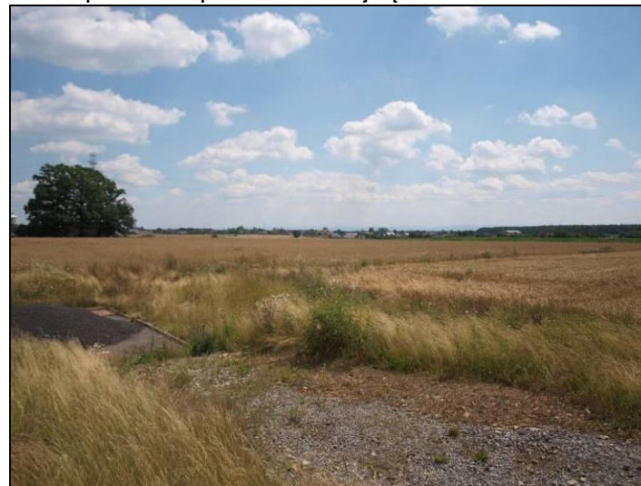
Fot. 4 Widok na tereny rolne w północno-wschodniej części obszaru nr 1