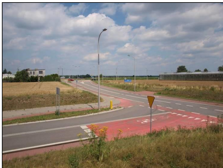
Fot. 5 Rejon połączenia ul. Goździków i ul. Cmentarnej, obszar nr 1