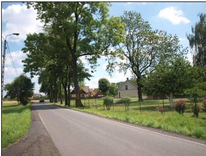
Fot. 1 Ul. Goździków, północna część obszaru nr 1