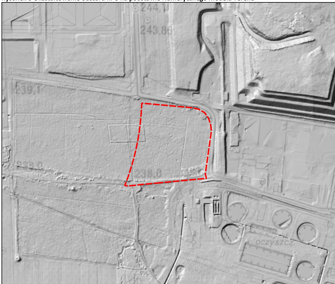
Rysunek 4 Ukształtowanie obszaru nr 4 na podstawie Numerycznego Modelu Terenu