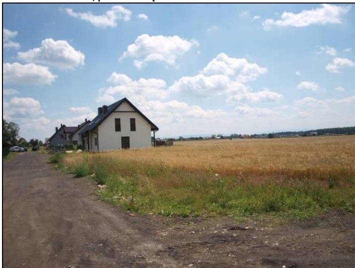
Fot. 2 Tereny rolne w północnej części obszaru nr 1