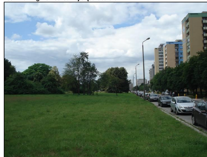
Fot. 8 Widok w kierunku zachodnim na centralną część obszaru nr 2