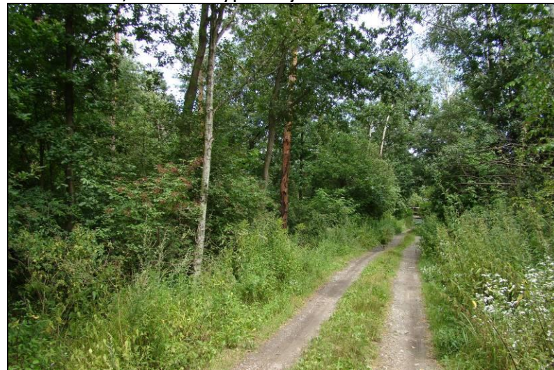
Fot. 24 Obszar nr 4, widok od strony południowej