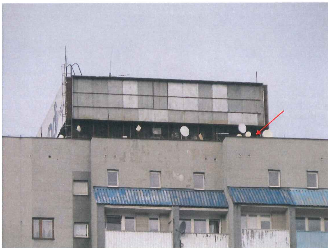
Widok instalacji radiokomunikacyjnej Stacja Netia TYCYB139 - TYCYM00046ANT016 Tychy, ul. Zofii Nałkowskiej 21.