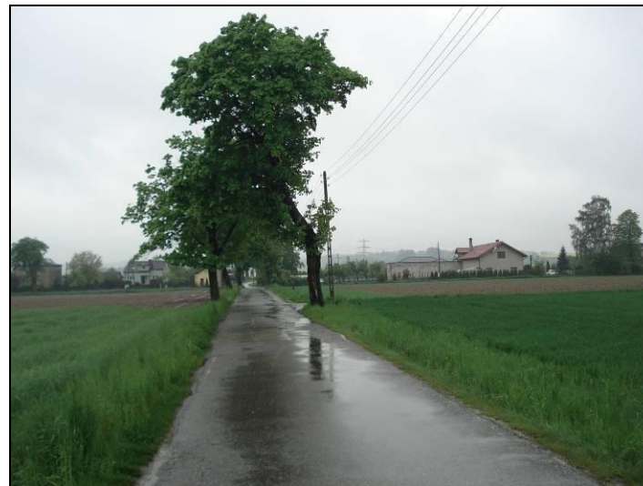
Fot. 3 Ul. Wierzbowa, południowa granica opracowania