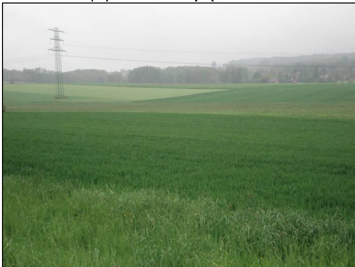
Fot. 6 Pola w północnej części obszaru