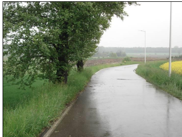
Fot. 7 Ul. Wierzbowa w południowej części obszaru