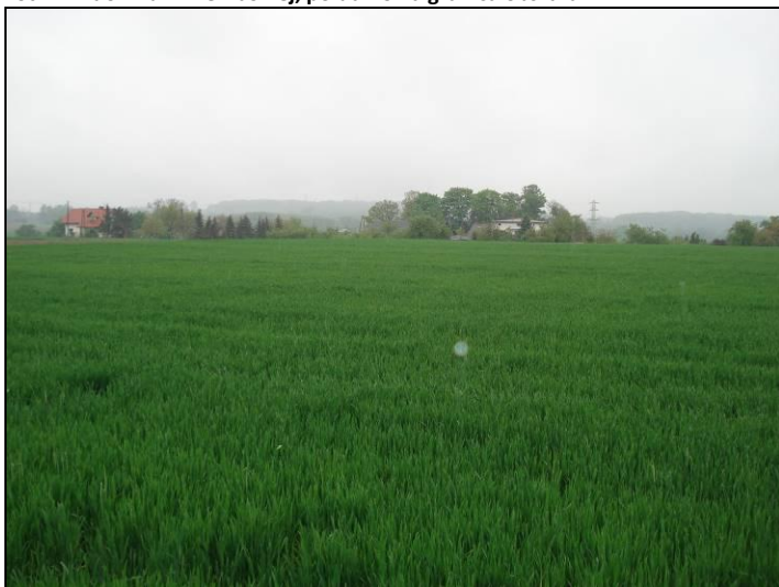
Fot. 2 Widok z ul. Wierzbowej w kierunku północnym