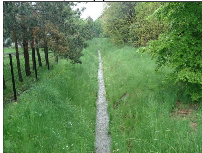
Fot. 8 Potok Tyski, poza północną granicą obszaru