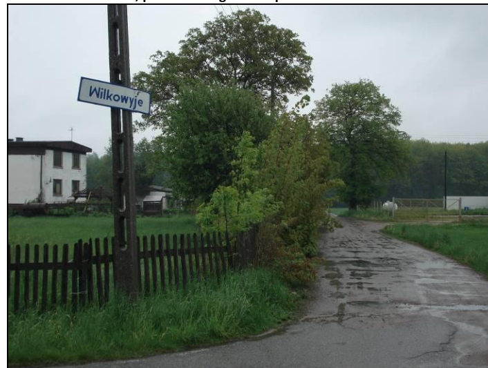
Fot. 4 Południowo-wschodnia część obszaru