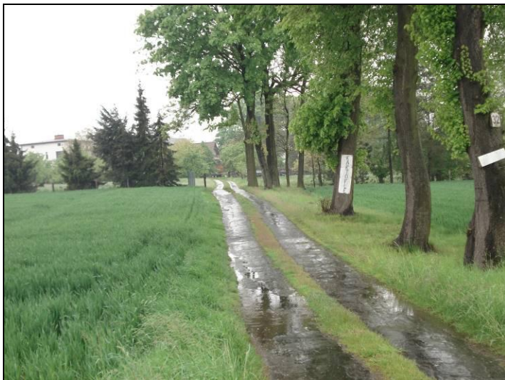
Fot. 5 Zadrzewienia przydrożne w centralnej części obszaru