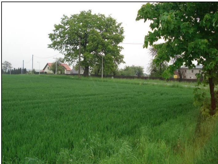
Fot. 1 Widok z ul. Wierzbowej, południowa granica obszaru