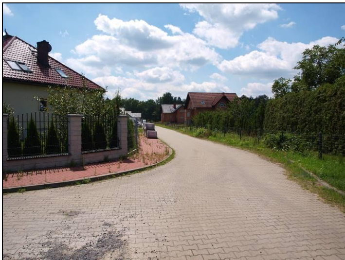
Fot. 1 Zabudowa w rejonie ul. Jankowickiej