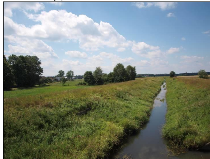
Fot. 12 Gostynia, widok z mostu na ul. Cielmickiej, poza granicami opracowania