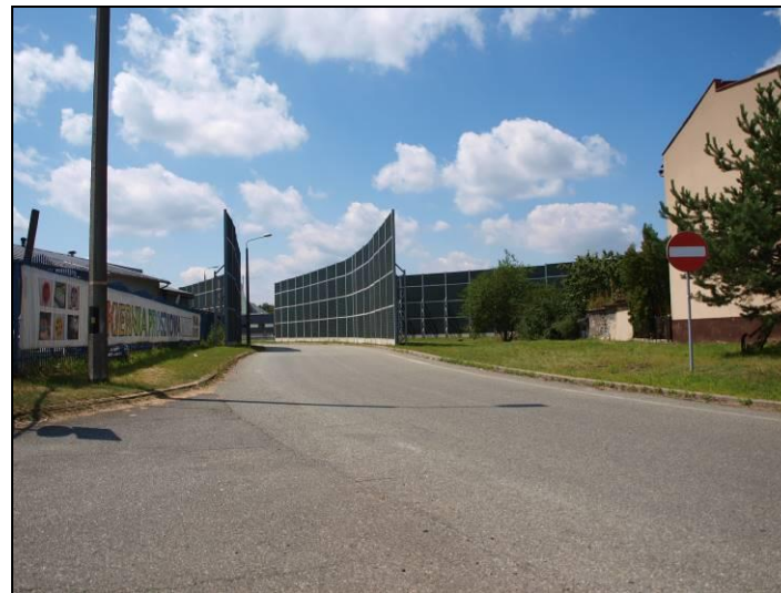
Fot. 3 Ul. Strzelecka i ekrany akustyczne przy DK1