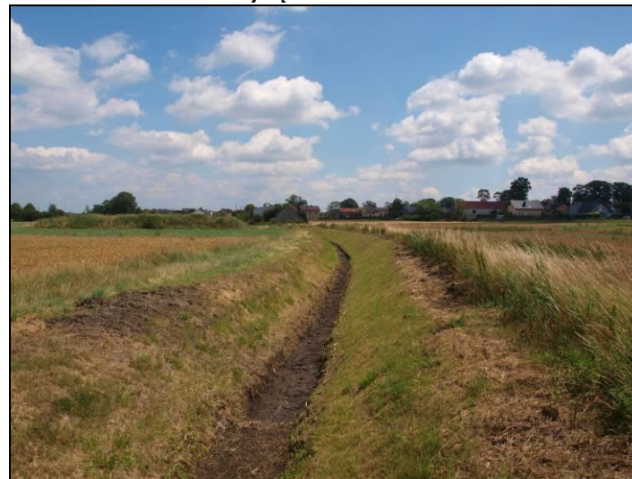
Fot. 8 Rów w dolinie Gostyni, północna część obszaru