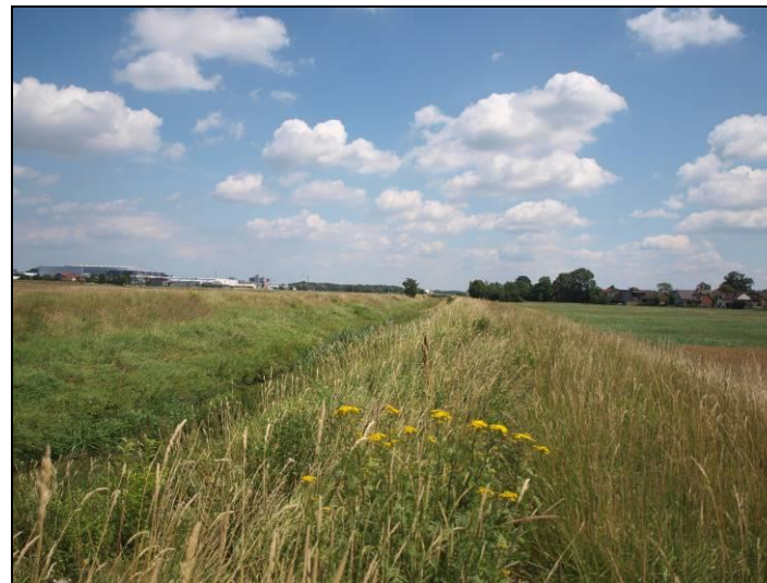
Fot. 11 Dolina Gostyni, widok w kierunku wschodnim