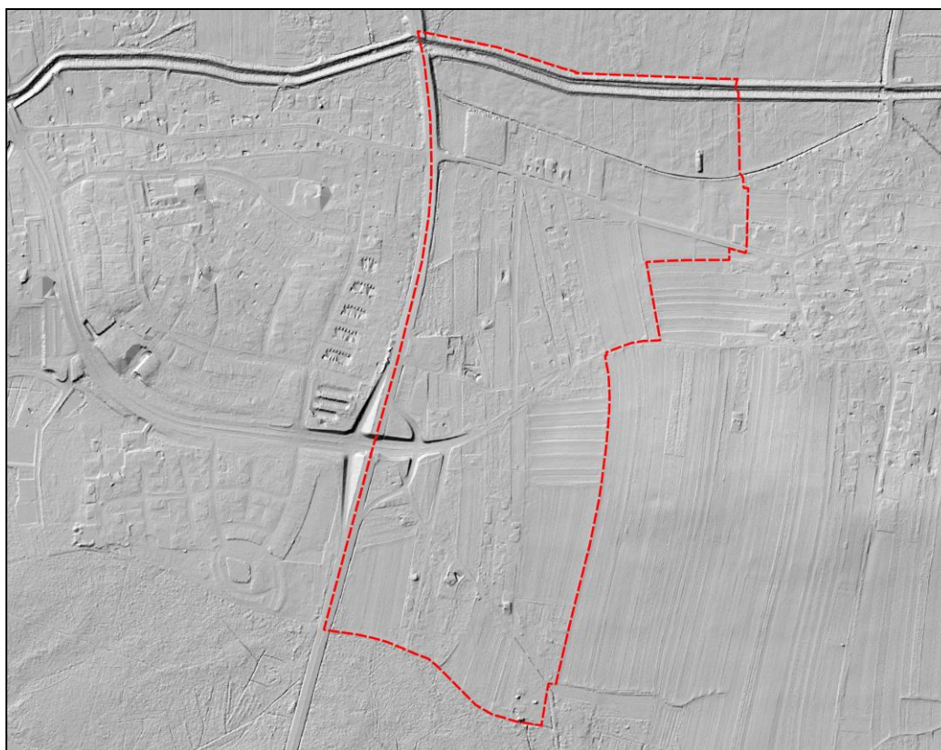
Rysunek 1 Ukształtowanie terenu na podstawie Numerycznego Modelu Terenu