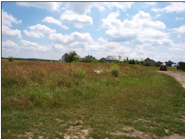
Fot. 5 Tereny rolne pomiędzy ul. Strzelecką i ul. Jankowicką