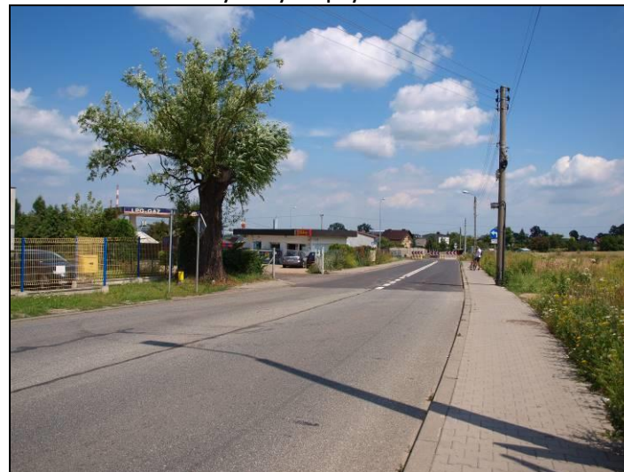
Fot. 4 Ul. Strzelecka, widok w kierunku wschodnim