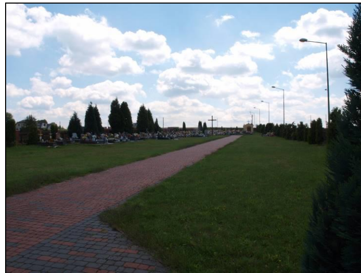
Fot. 7 Cmentarz we wschodniej części obszaru