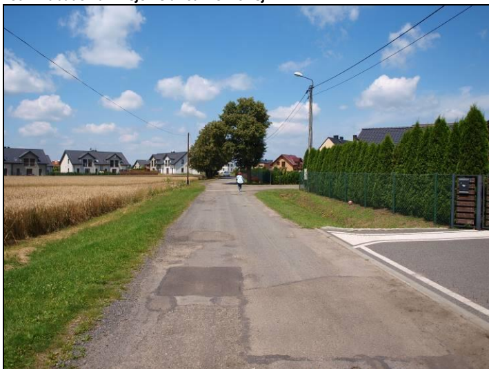
Fot. 2 Ul. Jankowicka