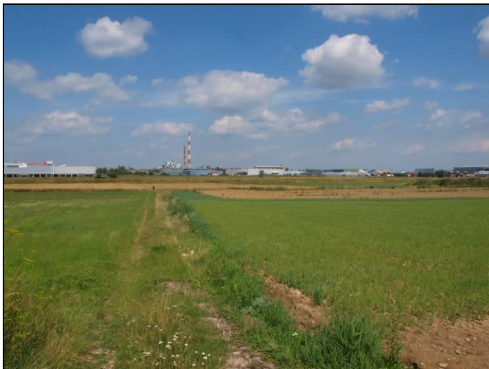
Fot. 9 Dolina Gostyni, widok w kierunku północnym