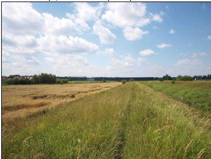
Fot. 10 Dolina Gostyni, widok w kierunku zachodnim