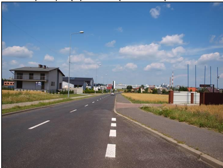
Fot. 6 Ul. Ks. K. Szojdy