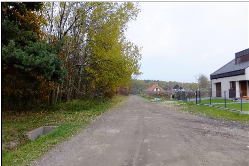
Fot. 5 Północna część ul. Piaskowej