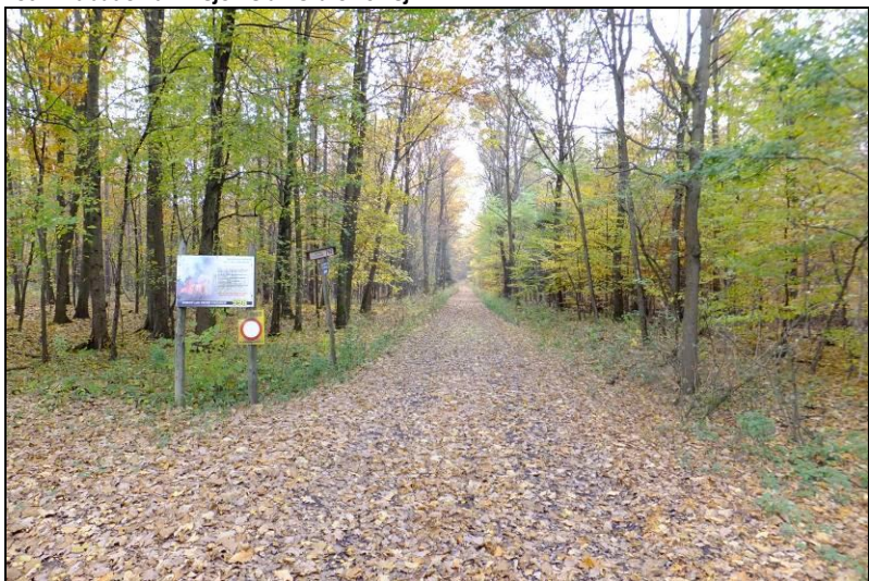
Fot. 2 Fragment Lasu Ogoniok, północna część terenu