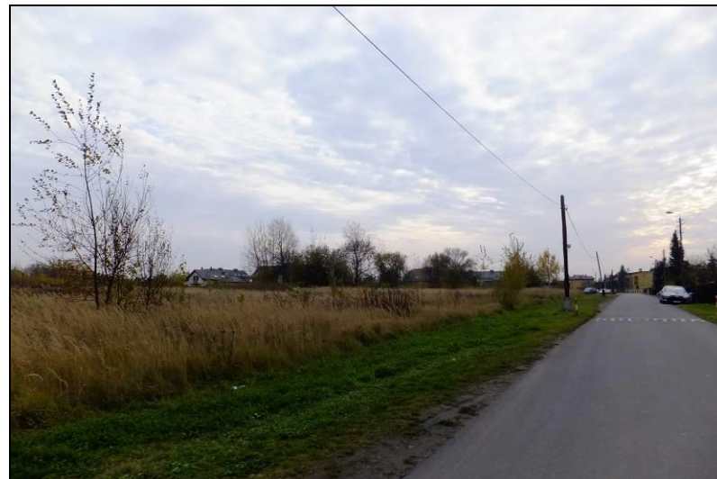
Fot. 7 Ul. Piaskowa, widoczne odłogowane grunty rolne