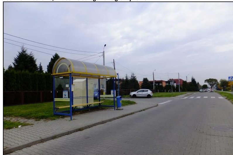
Fot. 8 Ul. Narcyzów, południowa część terenu objętego mpzp