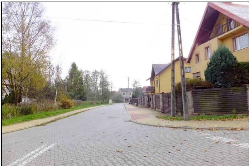
Fot. 1 Zabudowa w rejonie ul. Czułowskiej