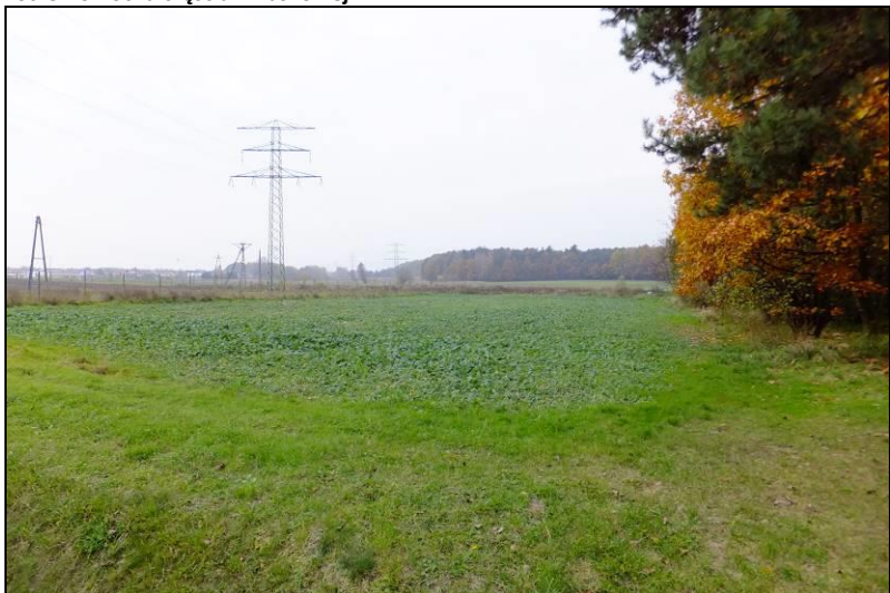
Fot. 6 Widok w kierunku doliny Dopytywu spod Mąkołowca