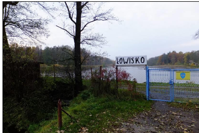
Fot. 3 Staw Drobowizna, widok z ul. Katowickiej