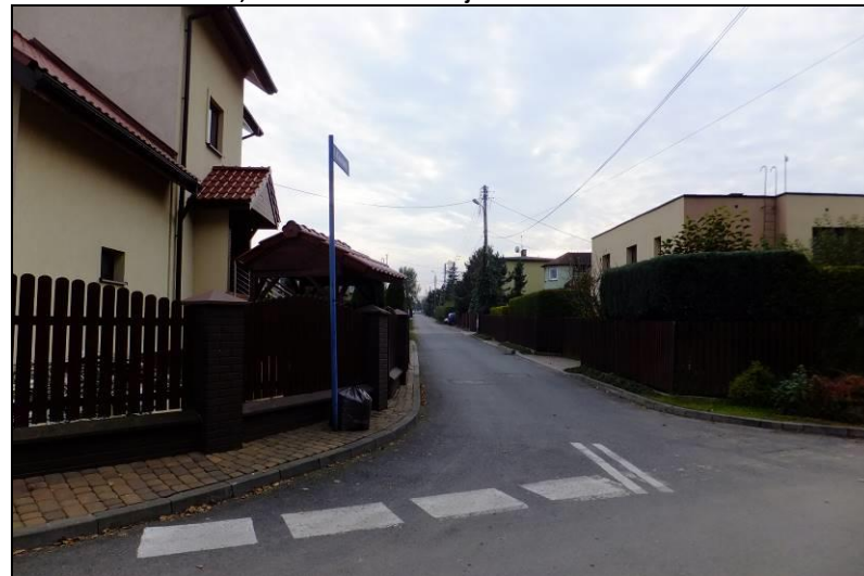
Fot. 4 Zabudowa w rejonie ul. Palmowej, północna część terenu