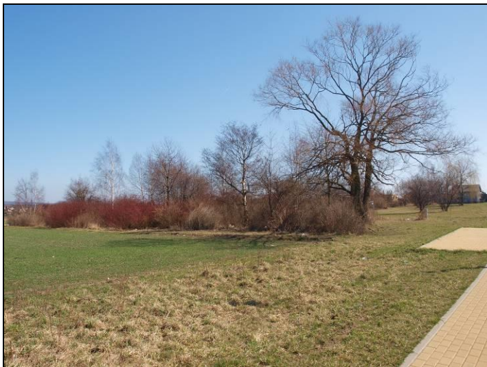
Fot. 1 Analizowany obszar, widok w kierunku wschodnim