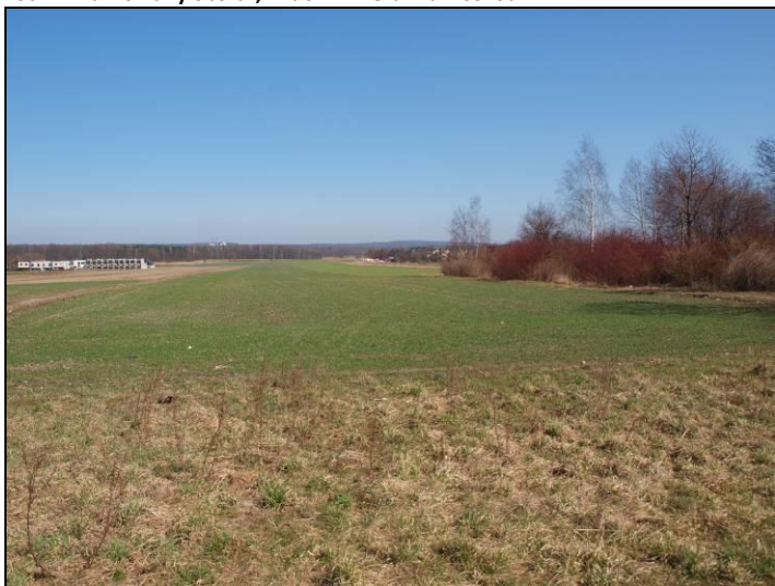
Fot. 2 Tereny rolne na zachód od analizowanego obszaru, widok w kierunku północnym