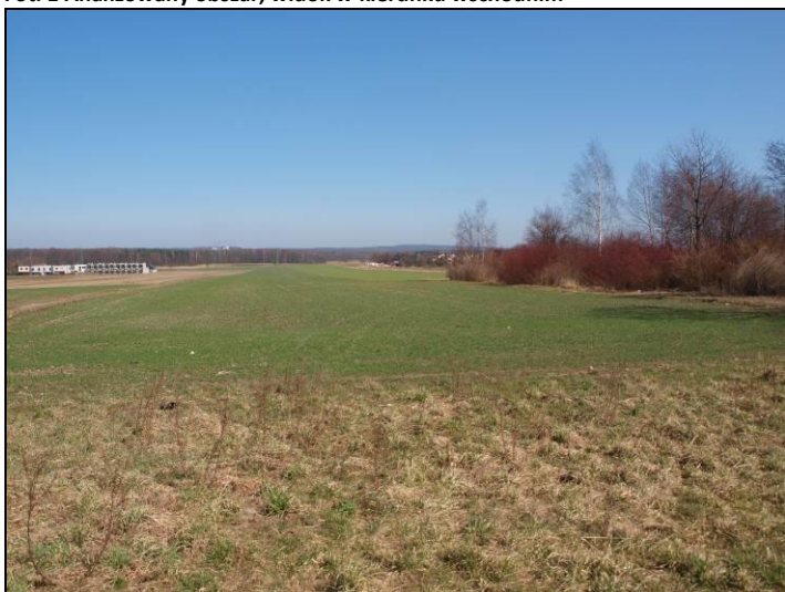
Fot. 2 Tereny rolne na zachód od analizowanego obszaru, widok w kierunku północnym