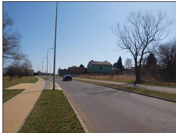
Fot. 3 Ul. Tulipanów, na południe od analizowanego obszaru