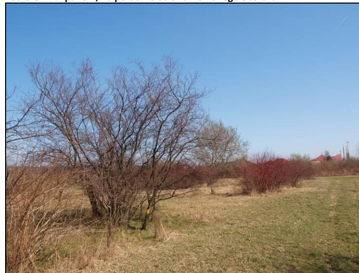
Fot. 4 Analizowany obszar, widok od strony wschodniej