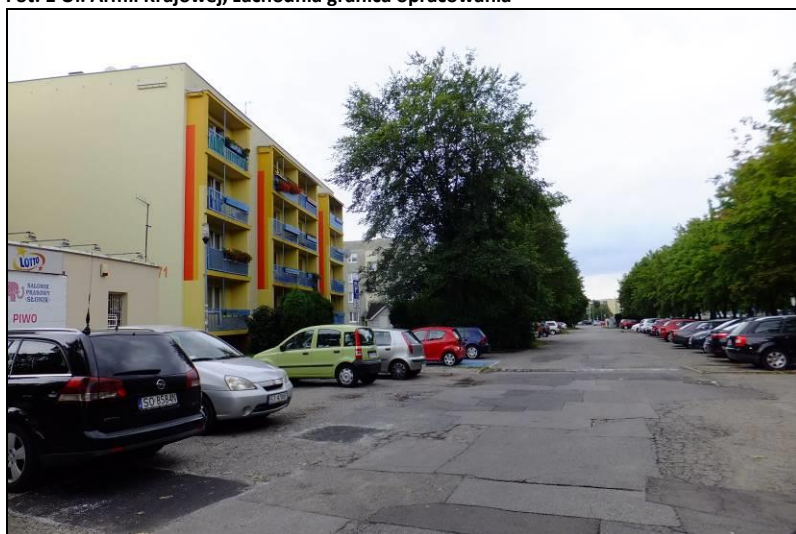
Fot. 2 Przykład zabudowy wielorodzinnej w południowo-zachodniej części obszaru