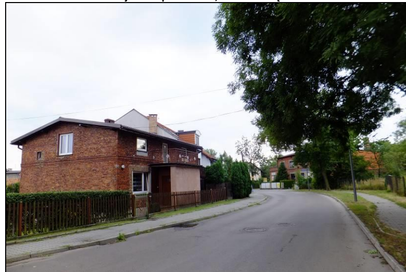
Fot. 4 Przykład zabudowy jednorodzinnej w północno-wschodniej części obszaru, ul. Paprocańska