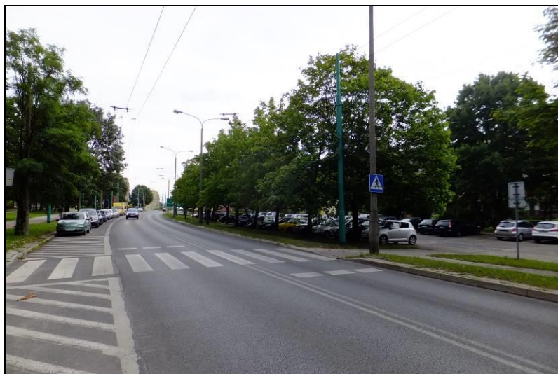
Fot. 1 Ul. Armii Krajowej, zachodnia granica opracowania