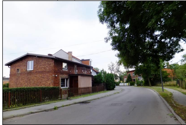
Fot. 4 Przykład zabudowy jednorodzinnej w północno-wschodniej części obszaru, ul. Paprocańska