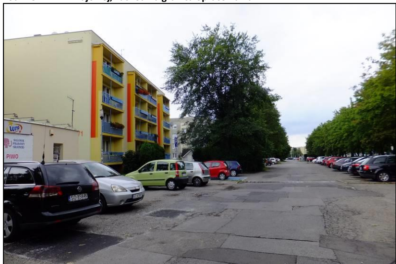
Fot. 2 Przykład zabudowy wielorodzinnej w południowo-zachodniej części obszaru