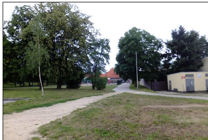
Fot. 3 Niewielki skwer i dojście do przedszkola, centralna część obszaru