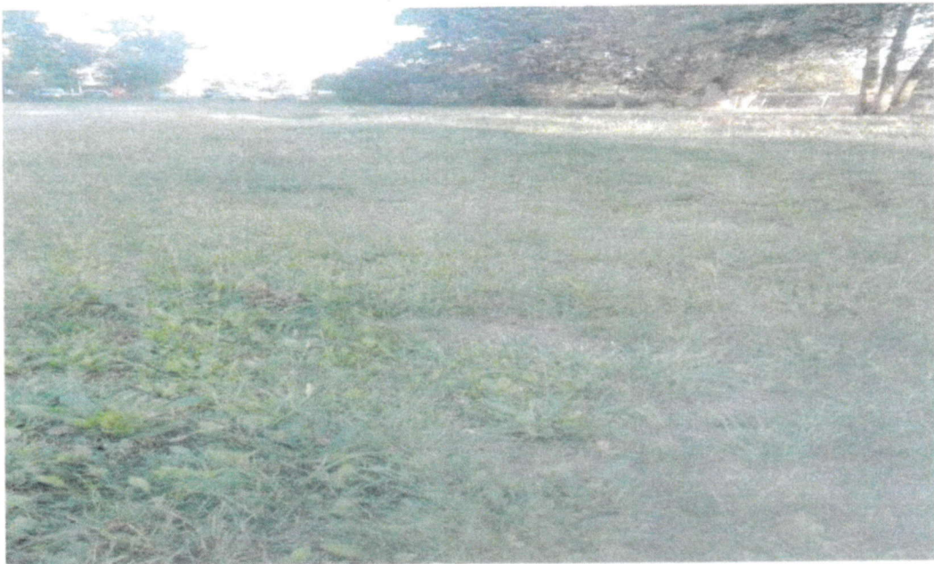
Zdj. 6 Rozbieg do skoku w dal 2017-08-30