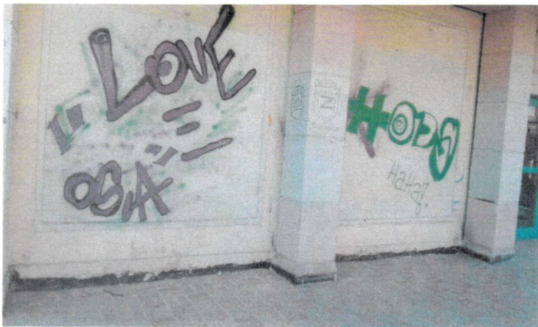
Zdj. 15 Elewacja SP Nr 3. 2017-08-30