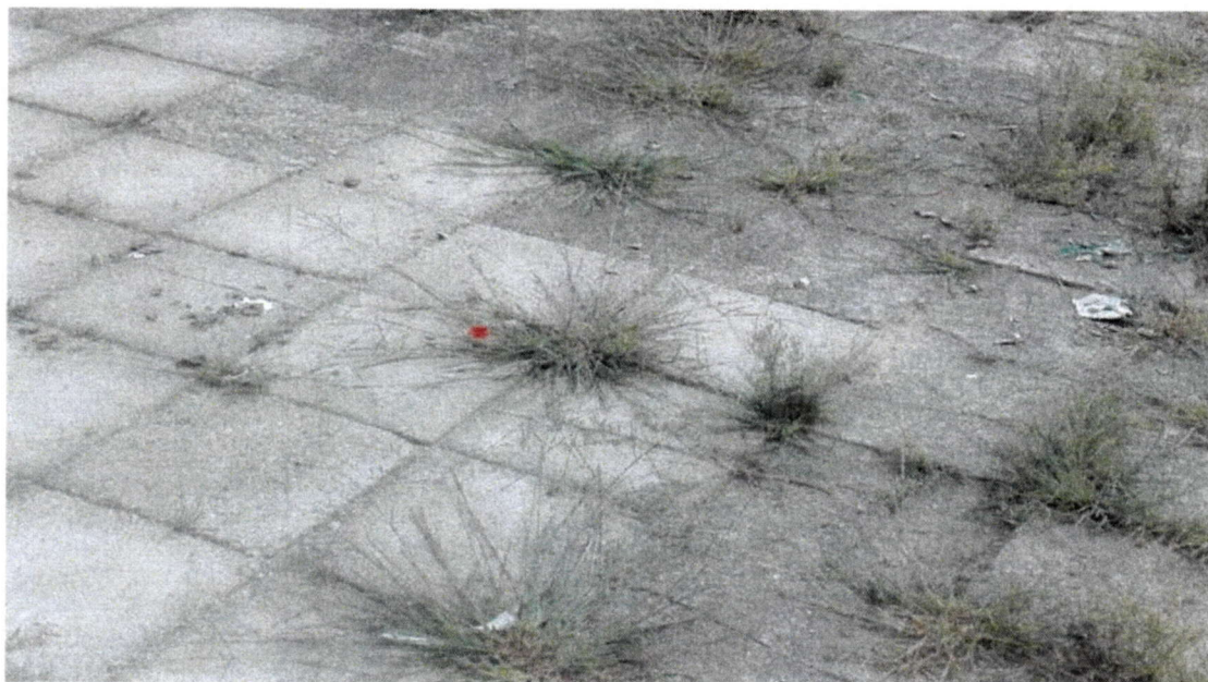
Zdj.2 Nawierzchnia przy budynku szkoły 2017-08-30