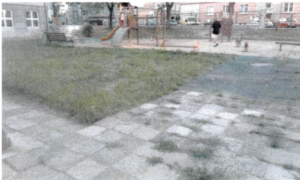
Zdj. 14 Nawierzchnia Placu Zabaw przy SP Nr 3. 2017-08-30