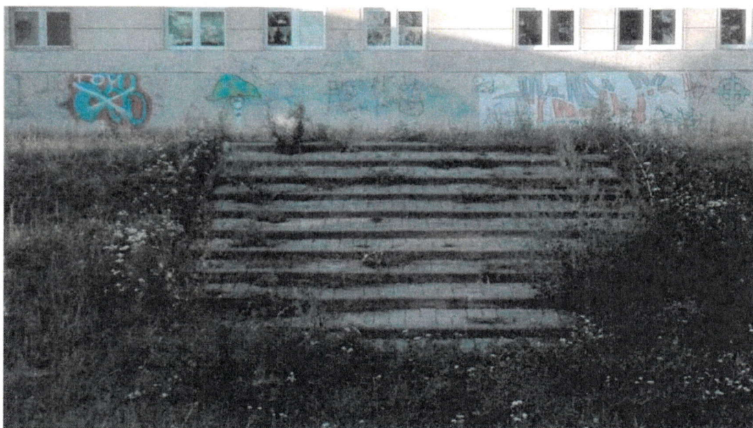
Zdj.4 Nawierzchnia na terenie SP Nr 3. 2017-08-30