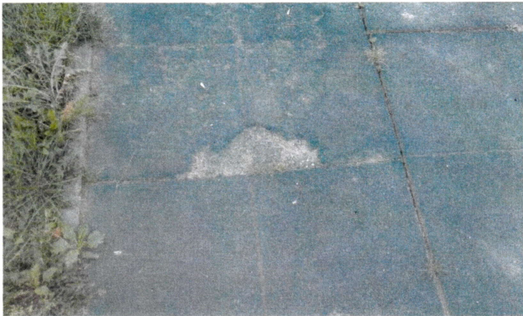
Zdj. 13 Nawierzchnia Placu Zabaw przy SP Nr 3. 2017-08-30