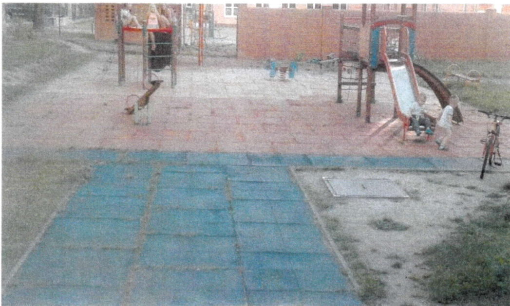
Zdj. 12 Plac Zabaw przy SP Nr 3. 2017-08-30