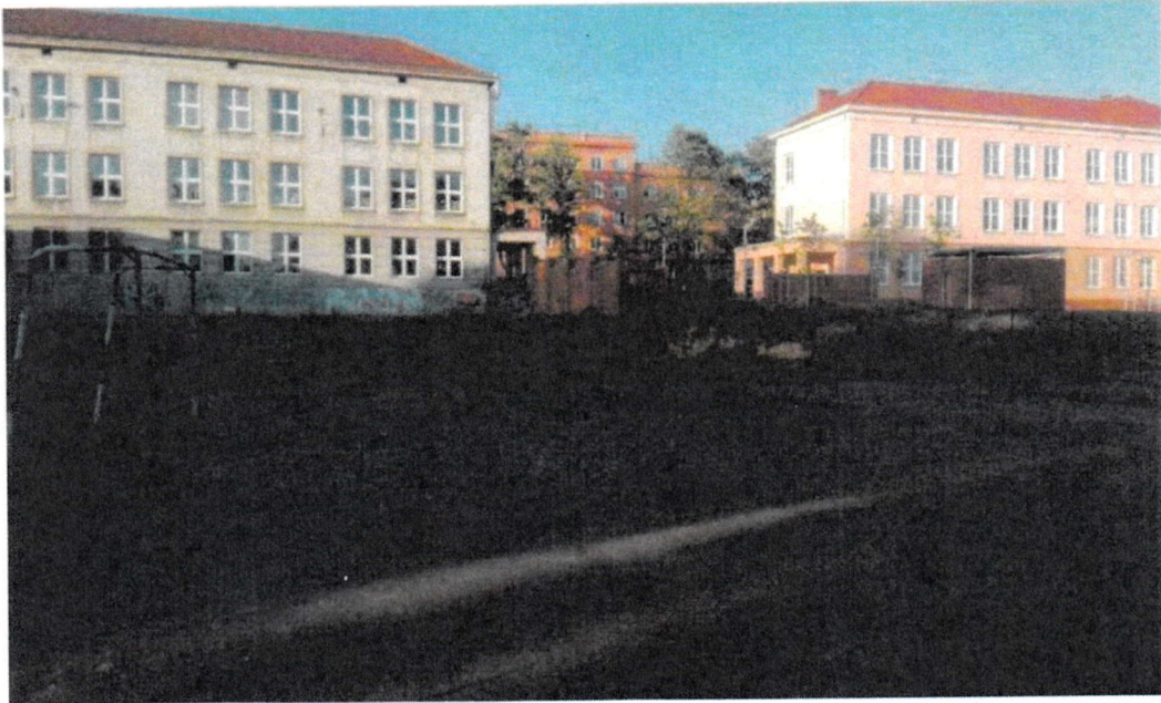
Zdj. 5 Szkoła Podstawowa nr 3 a budynek Prokuratury 2017-08-30