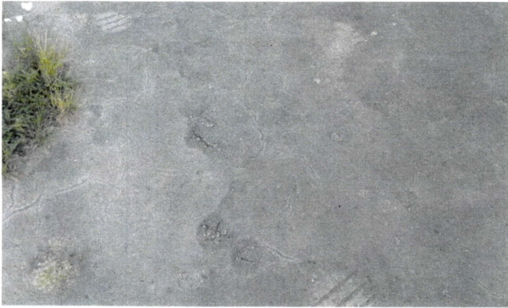
Zdj. 7 Nawierzchnia „Orlika” 2017-08-30