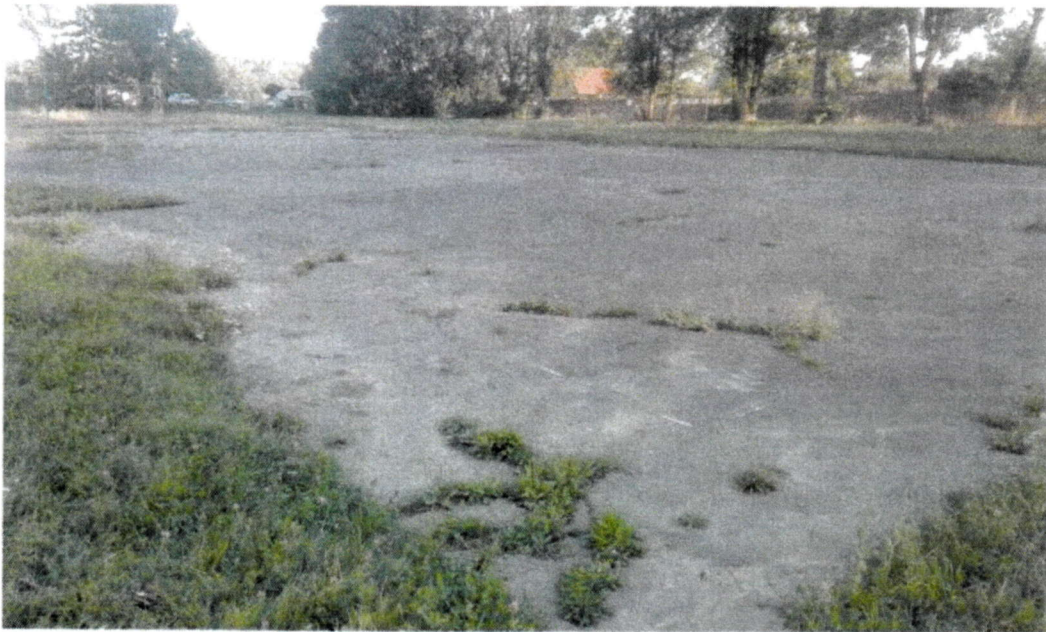
Zdj. 8 Boisko Szkoły Podstawowej nr 3 w Tychach. 2017-08-30