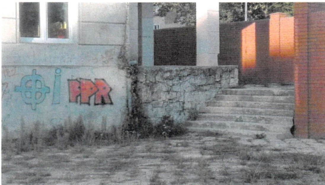
Zdj.3 Nawierzchnia przy boisku szkolnym 2017-08-30