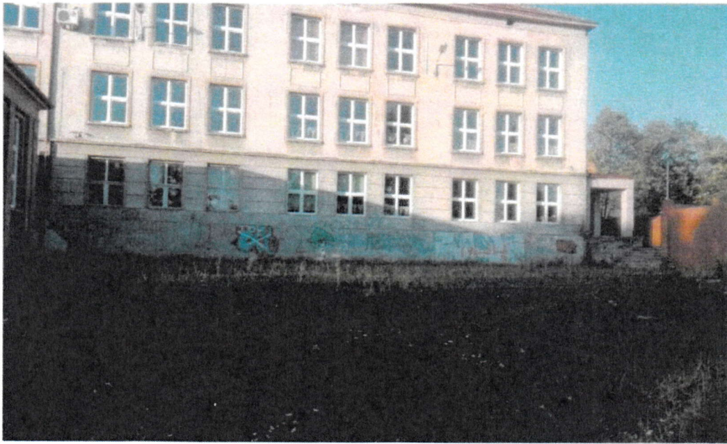
Zdj. 9 Zarośnięta „kostka brukowa” na terenie SP Nr 3 w Tychach. 2017-08-30