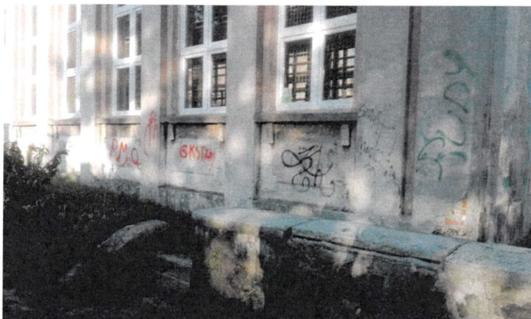
Zdj. 16 Elewacja SP nr 3. 2017-08-30