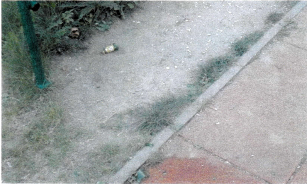
Zdj. 11 Teren Placu Zabaw przy SP Nr 3. 2017-08-30