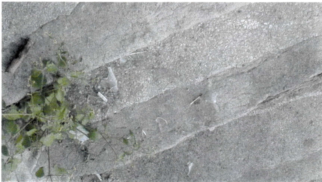
Zdj. 1 Schody na boisko szkolne. 2017-08-30