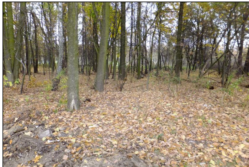
Fot. 7 Teren leśny przy ul. Gilów