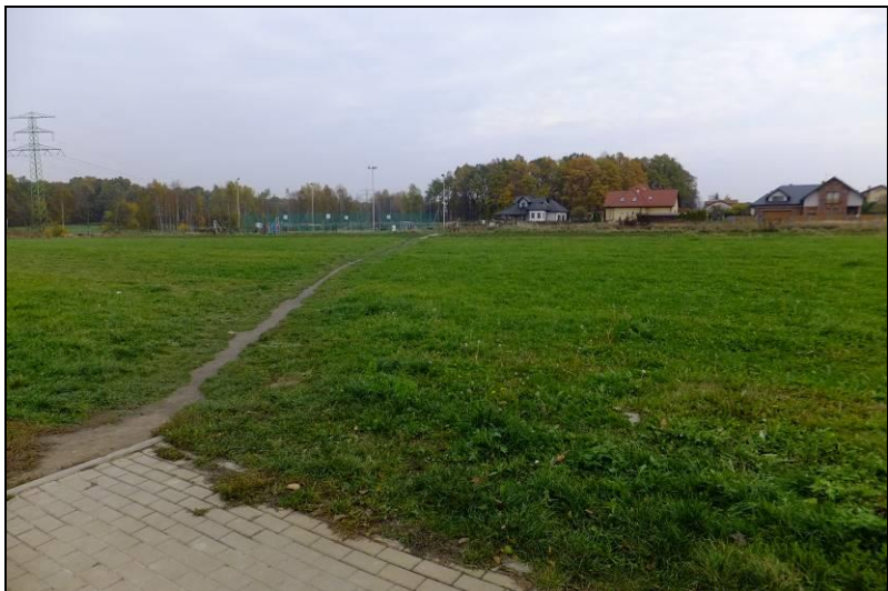
Fot. 5 Widok z ul. Gilów w kierunku zachodnim