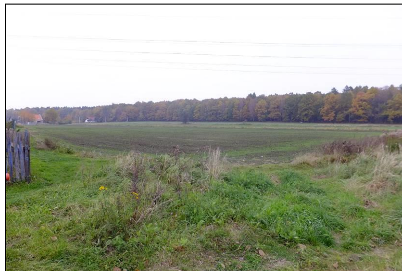
Fot. 4 Tereny rolne w dolinie Dopyłwu spod Mąkołowca, centralna część terenu