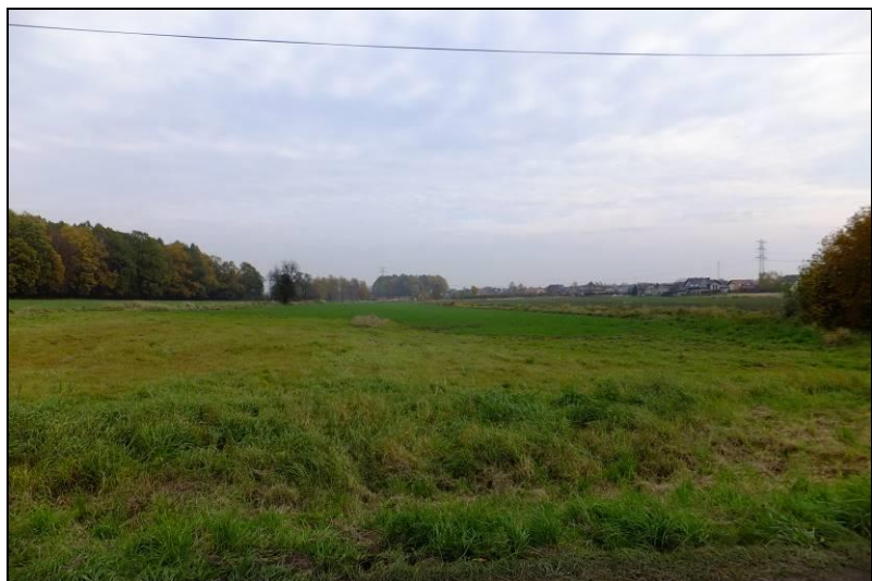
Fot. 1 Zachodnia część doliny Dopyłwu spod Mąkołowca, widok w kierunku wschodnim