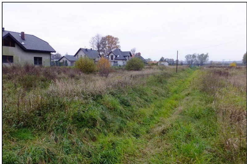
Fot. 2 Zachodnia część doliny Dopyłwu spod Mąkołowca, widok w kierunku zachodnim