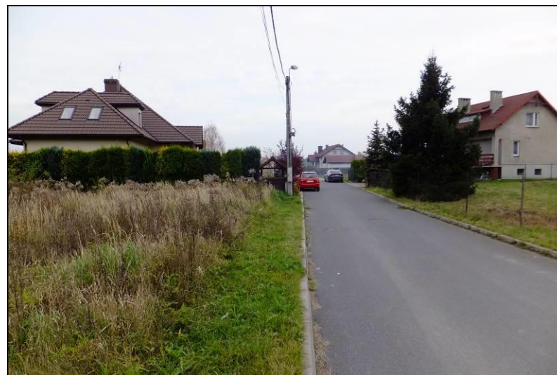
Fot. 3 Widok w kierunku wschodnim, ul. Bażancia