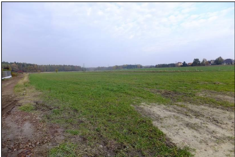
Fot. 9 Tereny rolne w części wschodniej terenu objętego mpzp