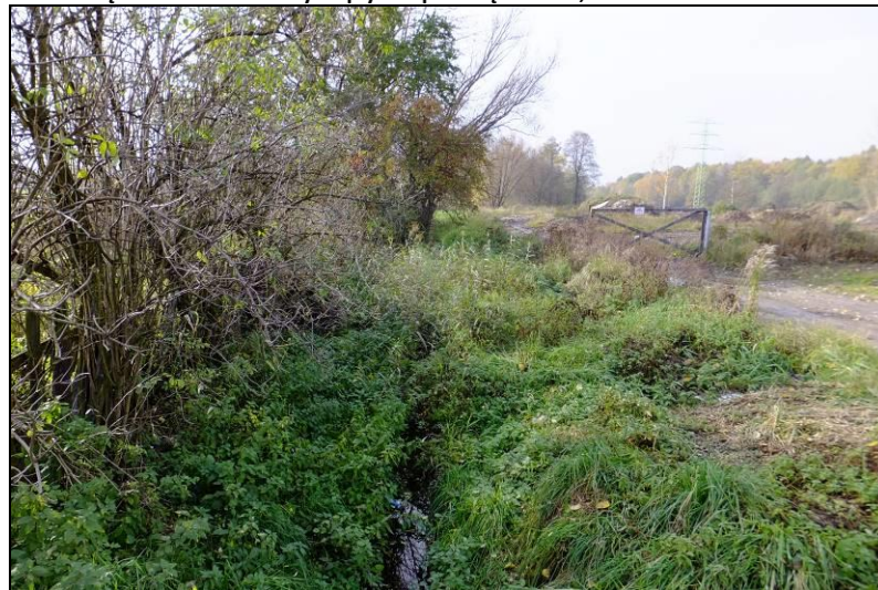
Fot. 12 Część wschodnia Doliny Dopływu spod Mąkołowca, widok w kierunku zachodnim z ul. Kolibrów