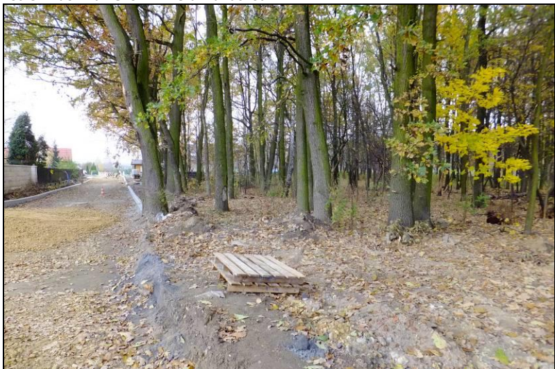
Fot. 6 Ul. Gilów, widok na teren leśny