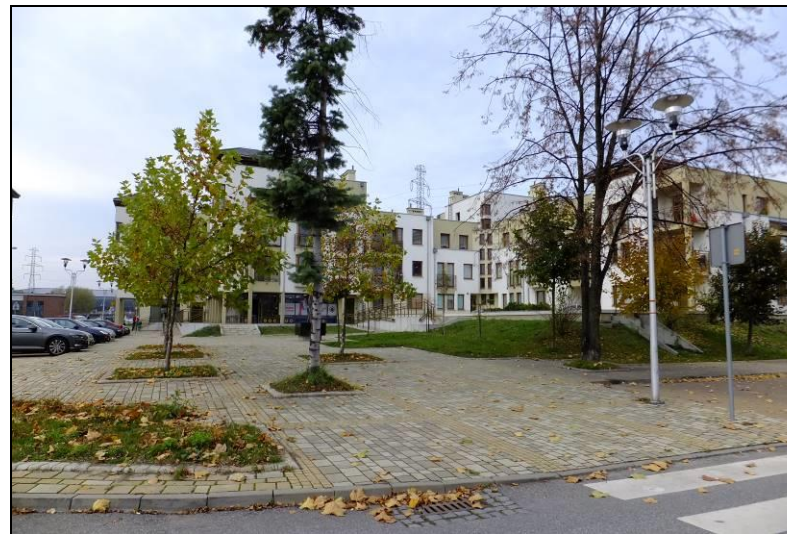
Fot. 3 Widok od strony zachodniej na budynek wielorodzinny, który znajduje się na południe od granic analizowanego terenu