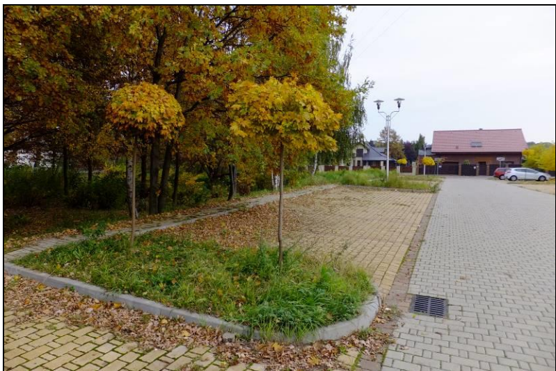
Fot. 2 Widok w kierunku wschodnim