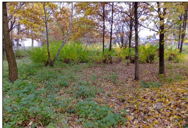
Fot. 4 Wnętrze zadrzewienia, które rośnie w centralnej i północnej części analizowanego terenu