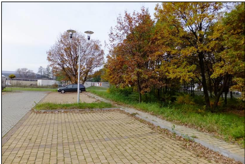
Fot. 1 Widok w kierunku zachodnim