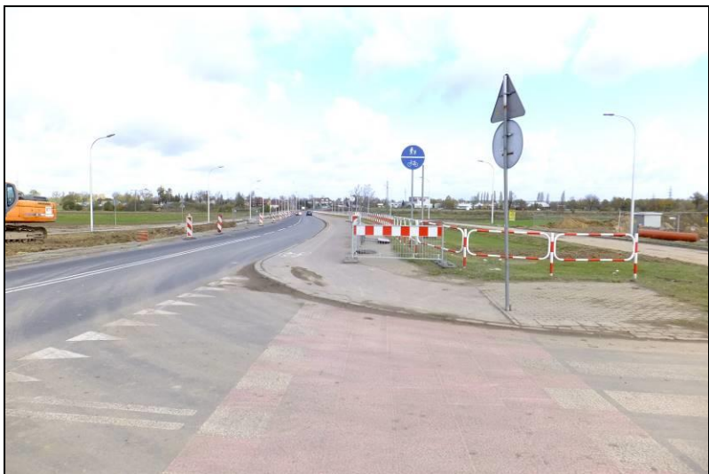
Fot. 2 Widok w kierunku północnym, ul. Serdeczna