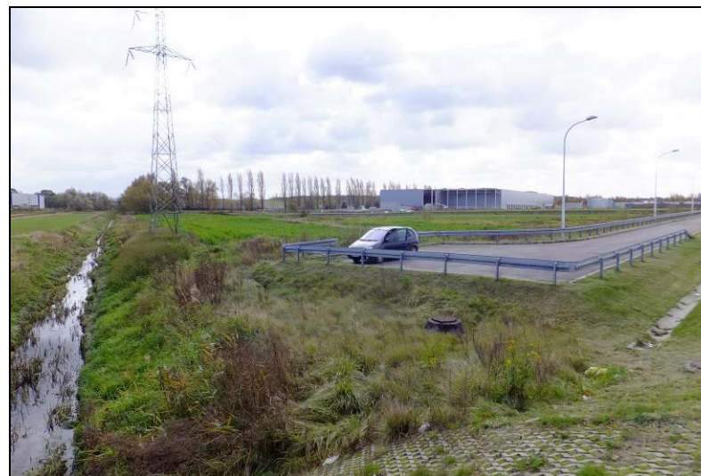
Fot. 4 Widok w kierunku południowo-wschodnim, na pierwszym planie widoczny Potok Tyski, na drugim planie nowo wybudowane obiekty magazynowe