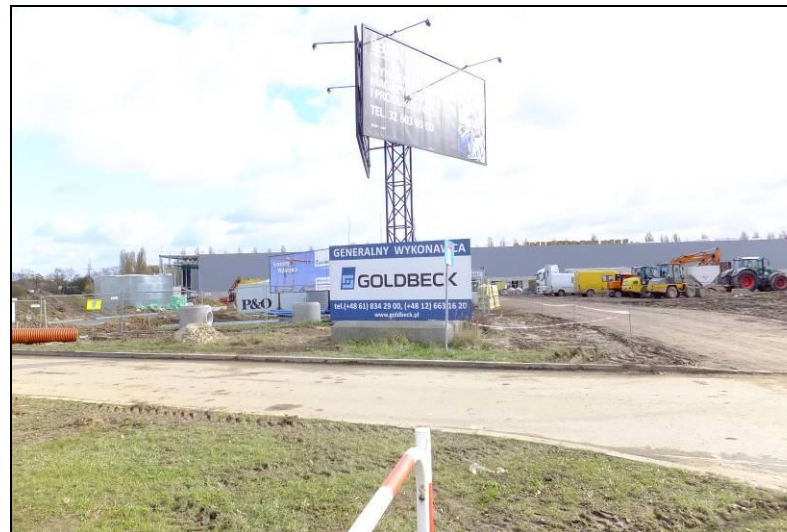
Fot. 3 Widok w kierunku wschodnim, nowo wybudowane obiekty magazynowe