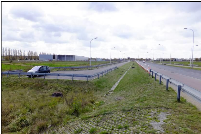
Fot. 1 Widok w kierunku południowym, ul. Serdeczna