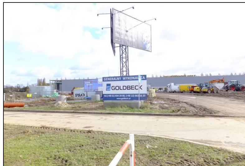
Fot. 3 Widok w kierunku wschodnim, nowo wybudowane obiekty magazynowe