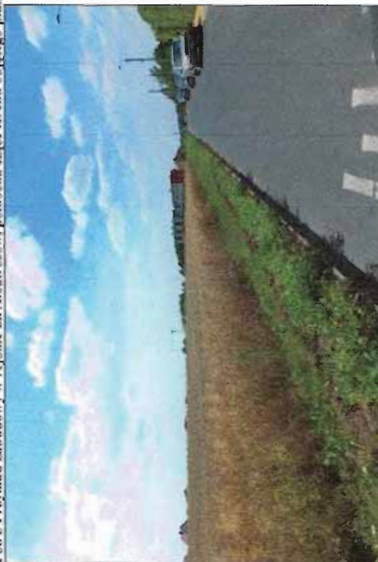
Fot. 6 Tereny rolne na południe od ul. Labędzkiej