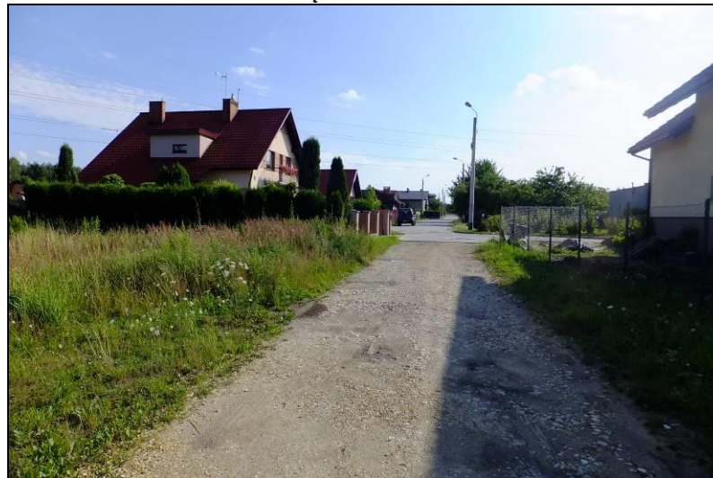
Fot. 12 Przykład zabudowy mieszkaniowej jednorodzinnej, ul. Modrzewiowa