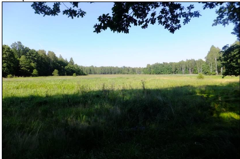
Fot. 6 Rejon Stawu Żogalik