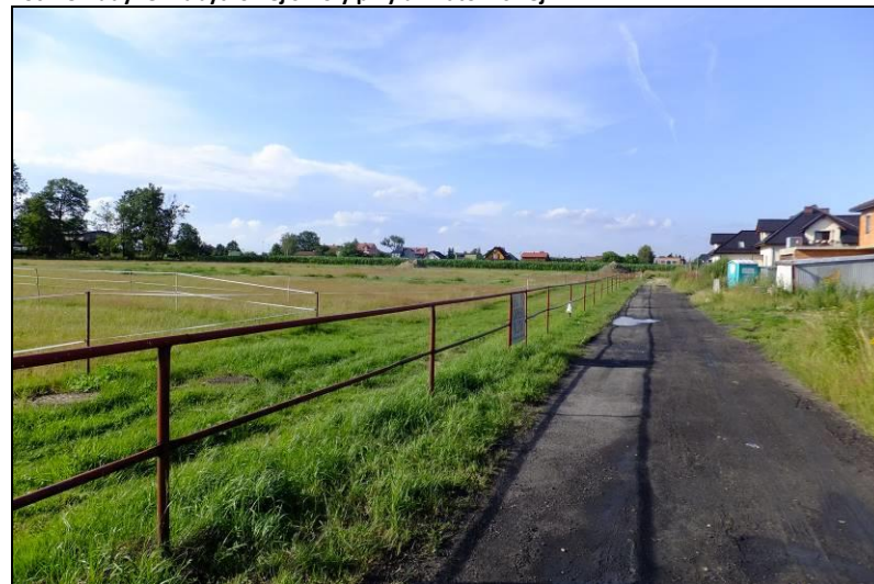
Fot. 16 Wybiegi dla koni oraz zabudowa mieszkaniowa w rejonie ul. Pomarańczy