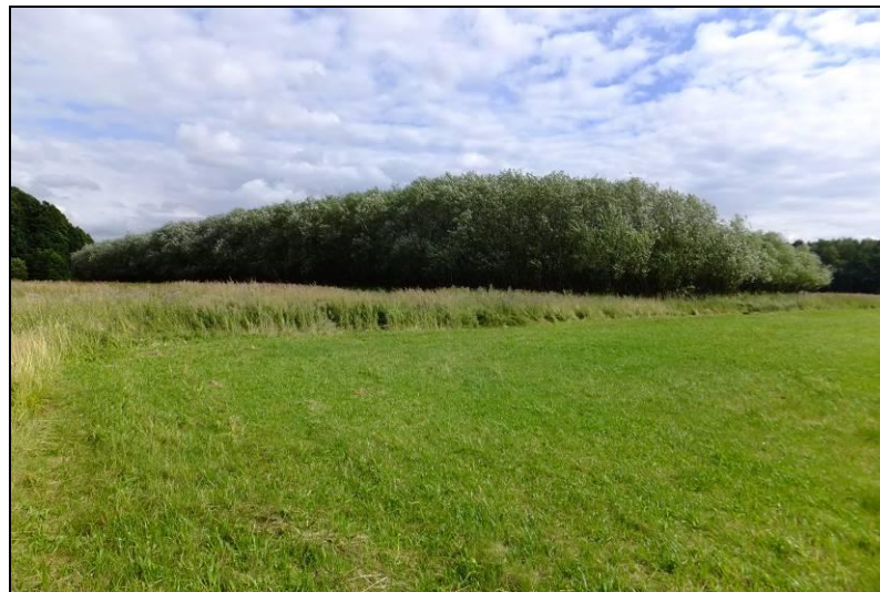
Fot. 11 Zadrzewienia wierzbowe na części terenu MN3