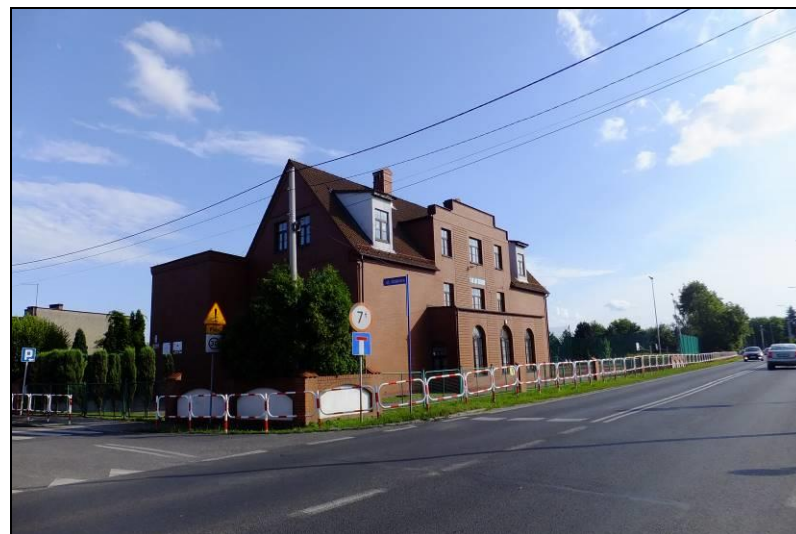
Fot. 15 Budynek zabytkowej szkoły przy ul. Katowickiej