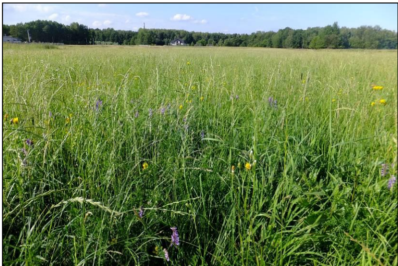
Fot. 9 Łąka na terenie MN3