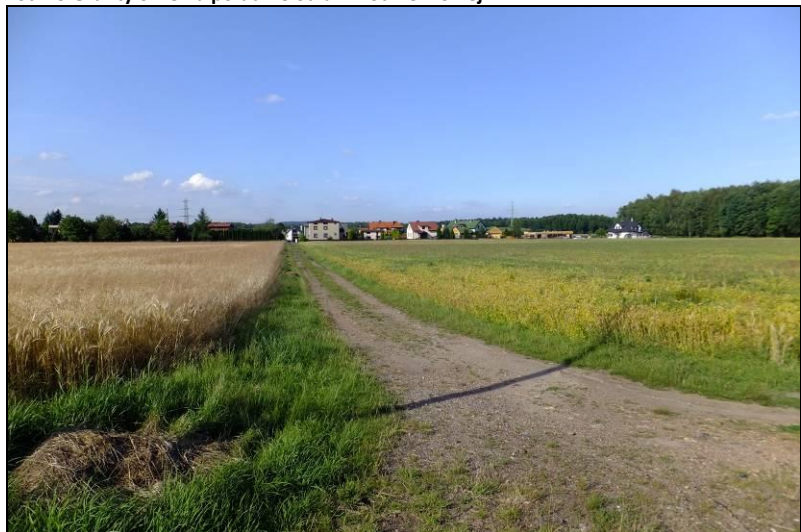
Fot. 14 Jak powyżej