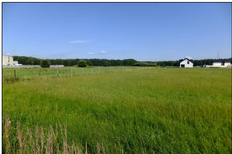
Fot. 5 Łąki na terenie MU2