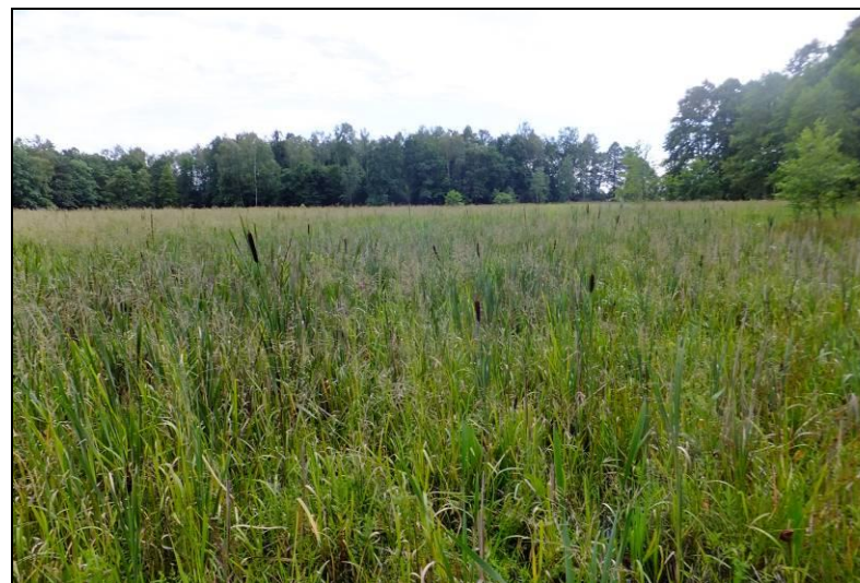
Fot. 7 Szuwary w rejonie Stawu Żogalik