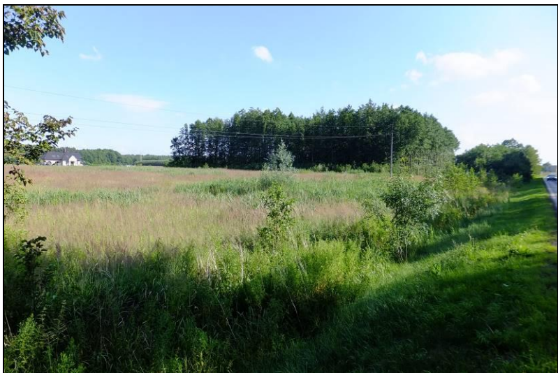
Fot. 2 Widok na zadrzewienie łąkowe na terenach MN1 i MU1 (drugi plan)