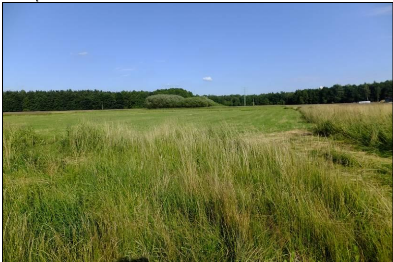
Fot. 10 Łąka na terenie MN3, w głębi kępa zadrzewień wierzbowych