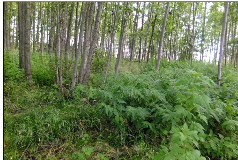
Fot. 3 Wnętrze zadrzewienia łąkowego na terenach MN1 i MU1