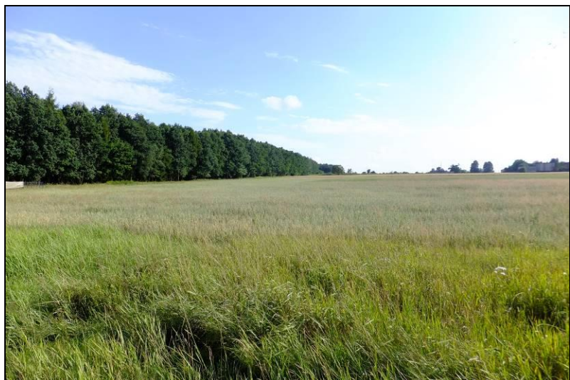
Fot. 13 Grunty orne na południe od ul. Modrzewiowej