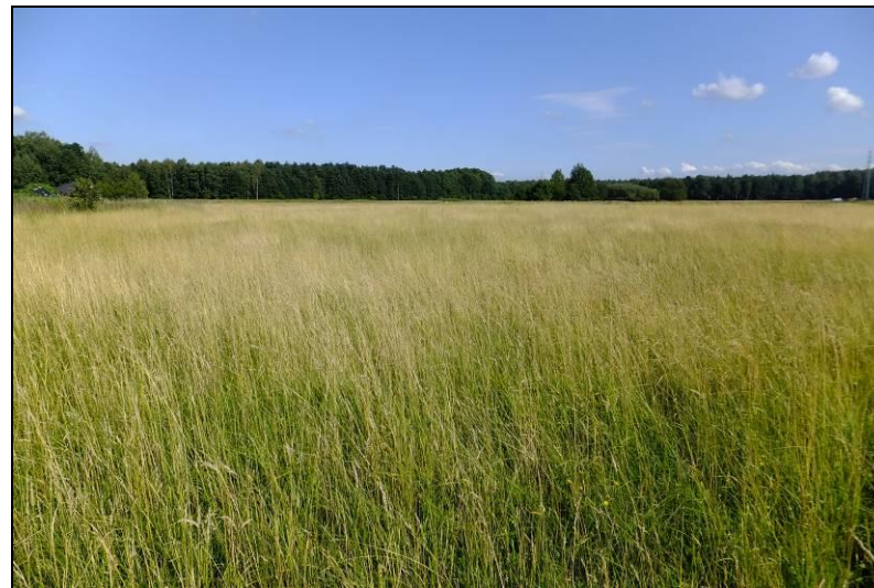
Fot. 4 Łąki na terenie MN2