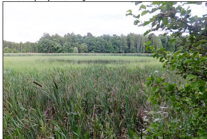
Fot. 8 Staw Żogalik