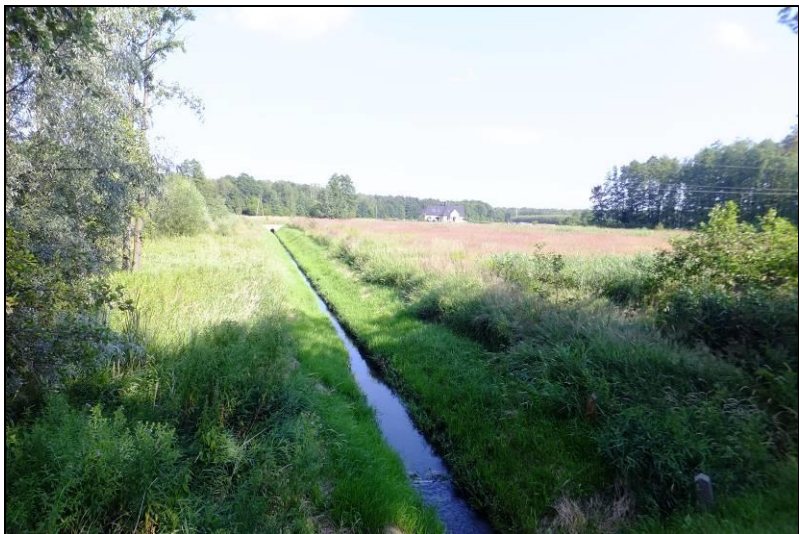
Fot. 1 Dopływ spod Mąkołowca, widok z ul. Katowickiej