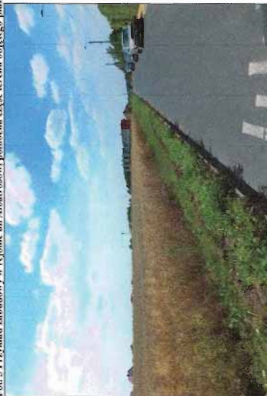
Fot. 6 Tereny rolne na południe od ul. Labędzkiej