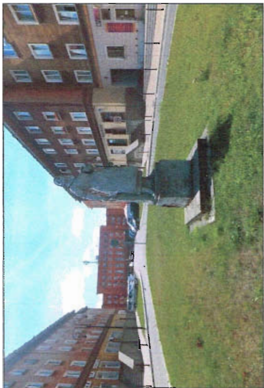
Fot. 7 Robotnica z kielnią, wejście na Plac Św. Anny od strony północnej