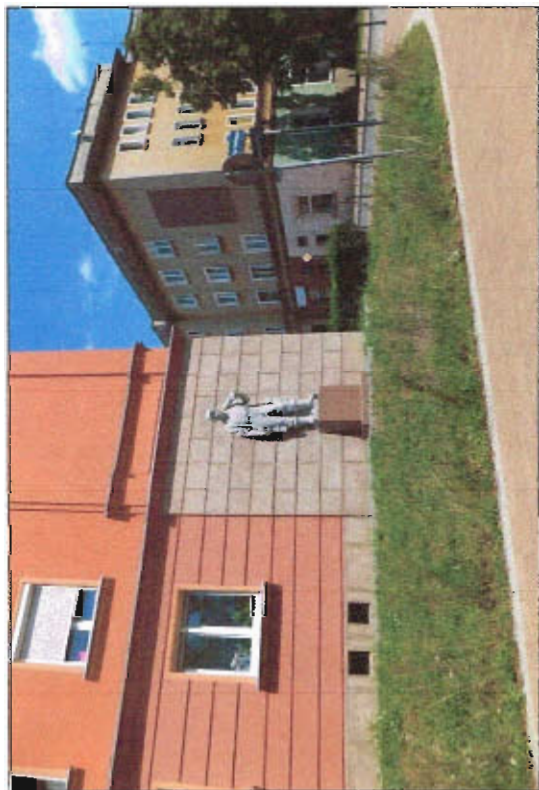
Fot. 5 Rzeźba robotnika przy ul. Wojska Polskiego