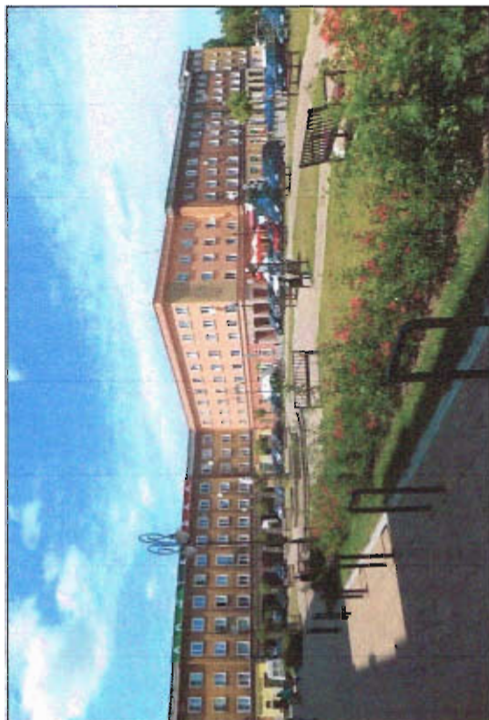
Fot. 3 Plac Św. Anny