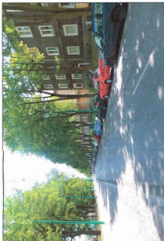
Fot. 1 Przykład zabudowy, ul. Andersa