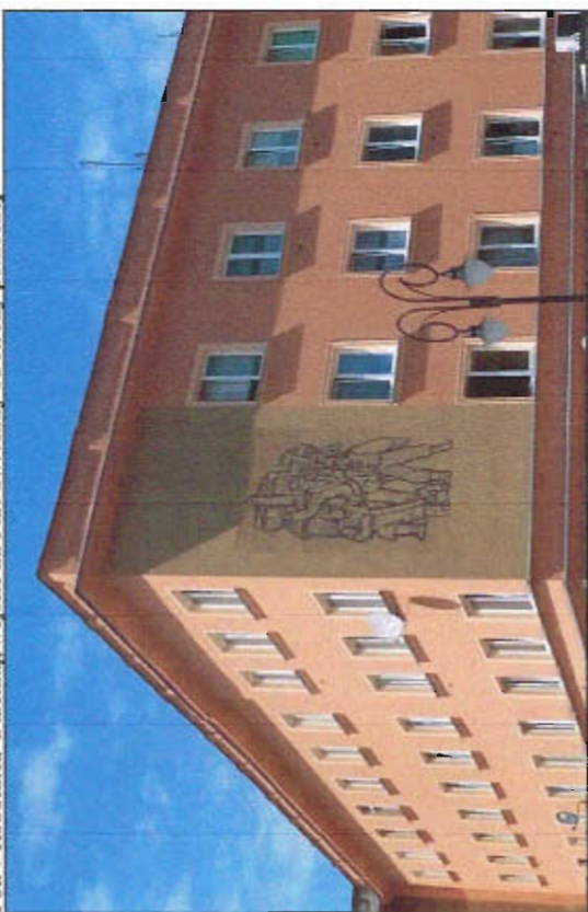
Fot. 8 Sgraffito na Placu Św. Anny