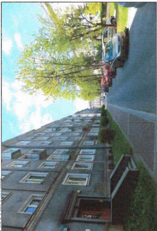
Fot. 4 Wnętrze jednego z kwartałów