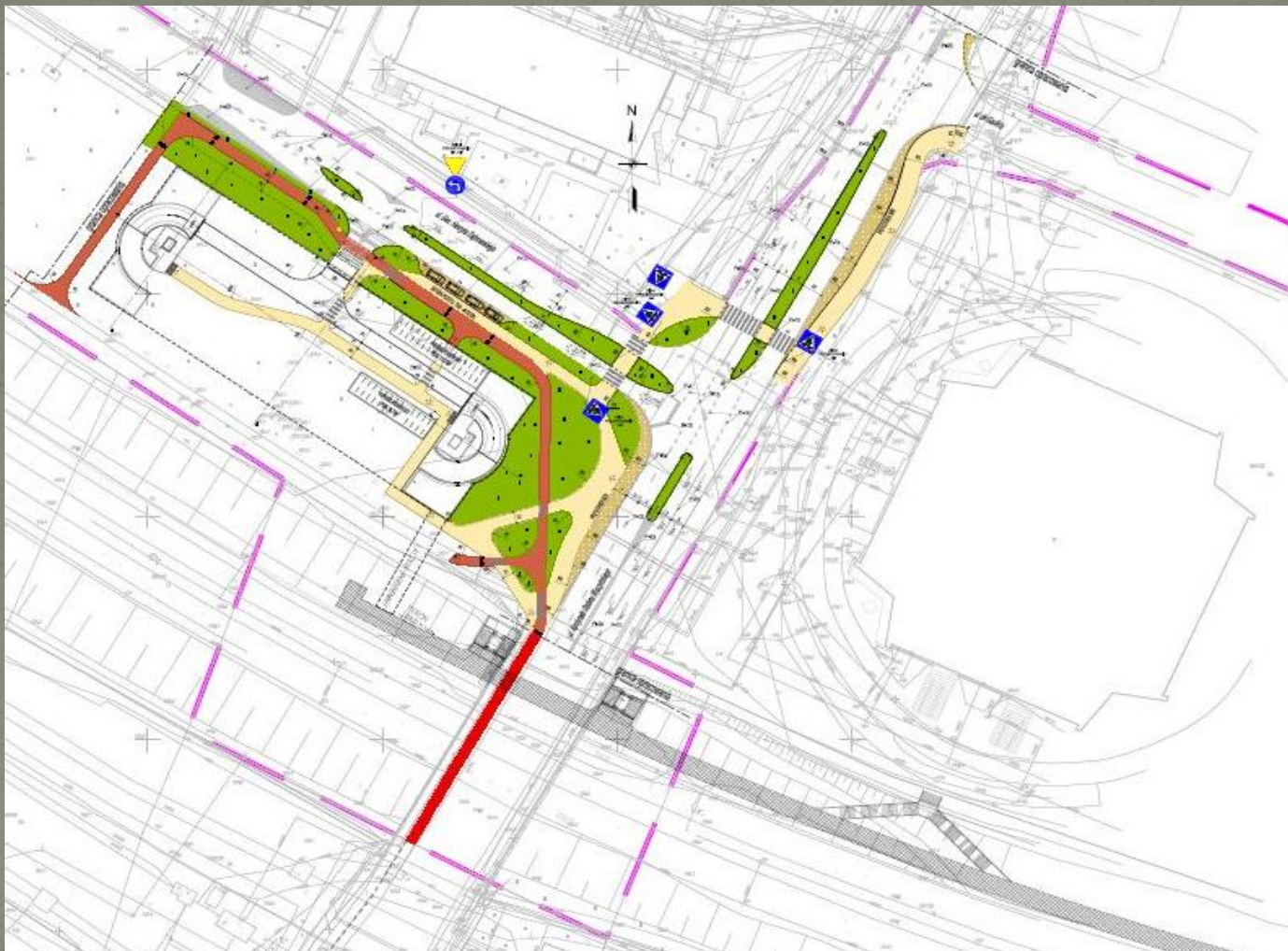
Mapa: Lokalizacja parkingu Park & Ride Tychy Lodowisko