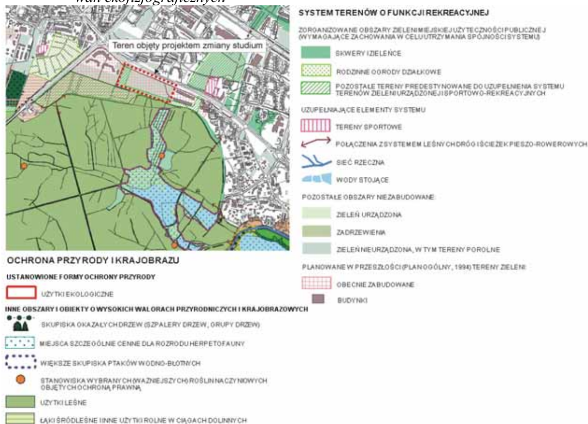
Rysunek 1 Lokalizacja obszaru objętego zmianą studium i jego otoczenia na tle uwarunkowań ekofizjograficznych