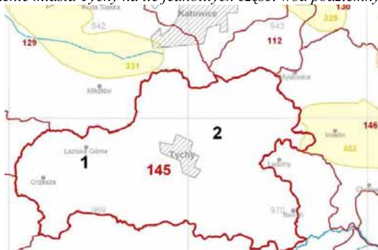
Rysunek 4 Położenie miasta Tychy na tle jednolitych części wód podziemnych (JCWPd)