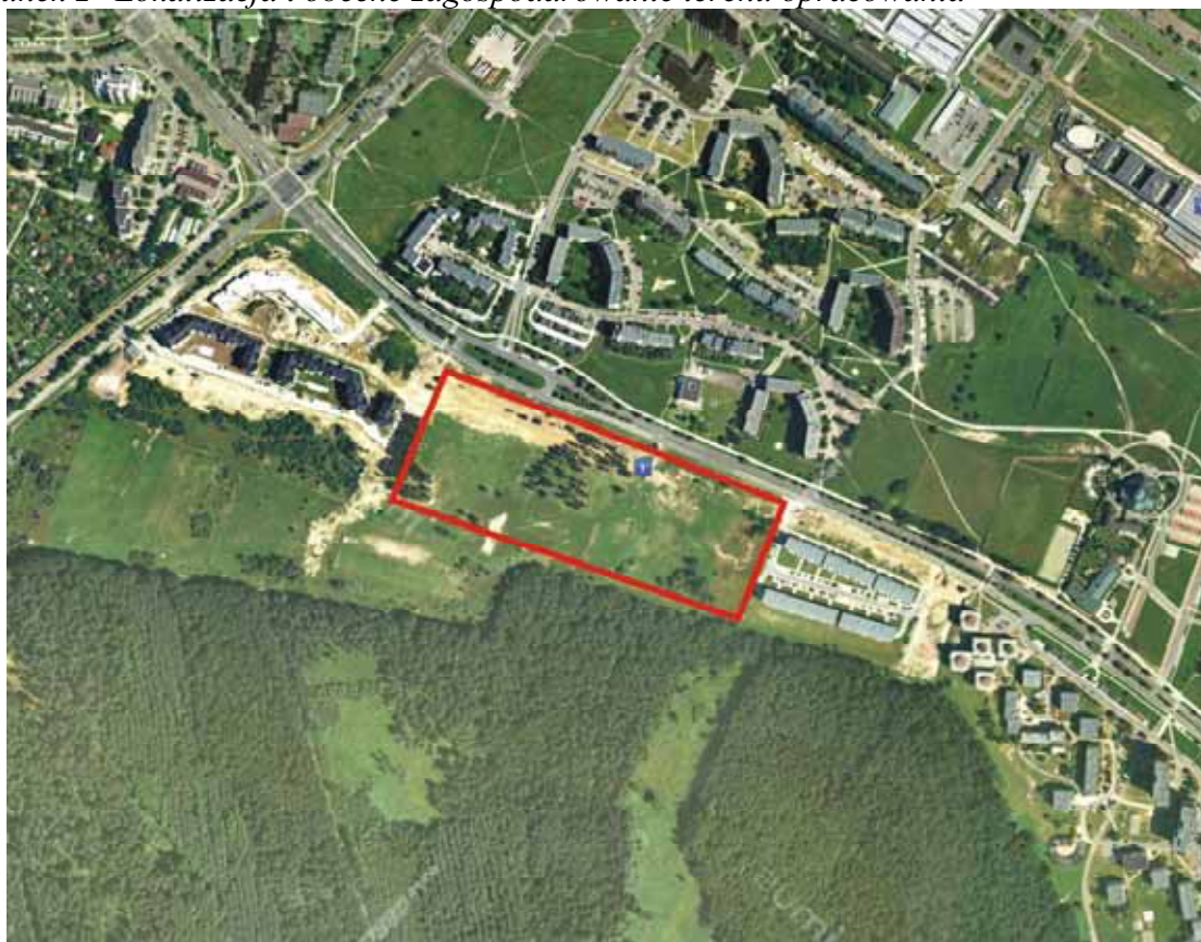
Rysunek 2 Lokalizacja i obecne zagospodarowanie terenu opracowania

Projekt zmiany studium uwarunkowań i kierunków zagospodarowania przestrzennego dotyczy niewielkiego fragmentu miasta położonego w rejonie ulicy Sikorskiego. Lokalizację i obecne zagospodarowanie analizowanego terenu przedstawia poniższy fragment ortofotomapy: